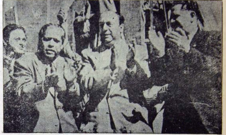
Pablo Neruda, Nâzım Hikmet'le beraber...