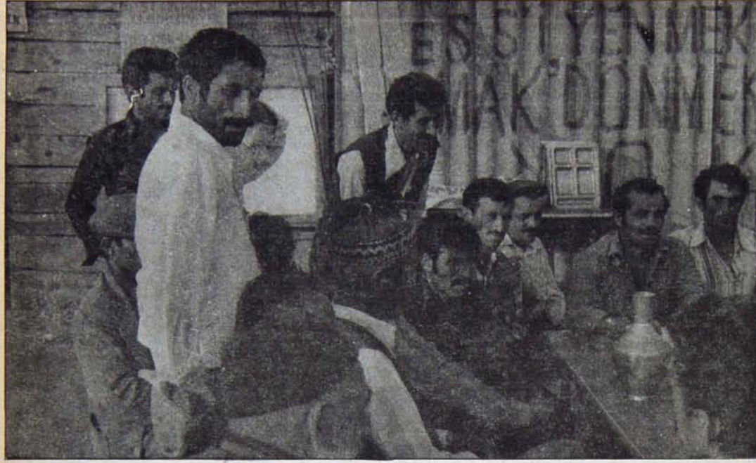
TEHDİTLERE PABUÇ BIRAKMAYACAKLAR