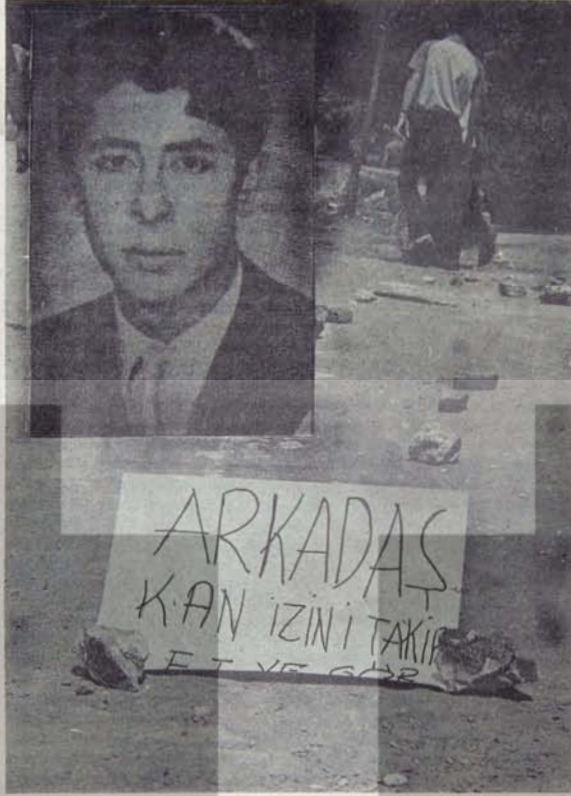
OLUMUGERİDE KALDI ANA MÜCADELESİ SURUYOR

O kanlı 17 Temmuz 1968 gecesi İstanbul Teknik Üniversitesinde bulunuyordu. Çünkü, Teknik Üniversite Motorlar Kursularının da öğrencisiydi. Kurstan sonra ABD 6. Filosuna karşı eylem yürüten Teknik Üniversiteli kardeşlerinin heyecanına o da katıldı.