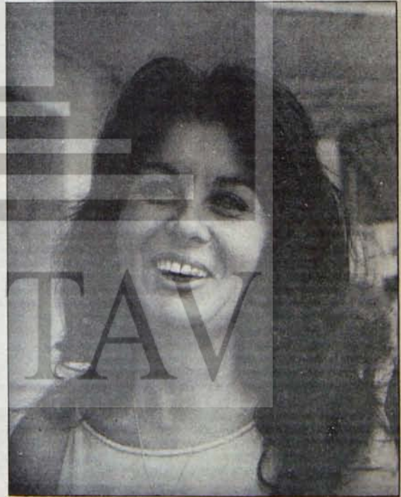
"KADIN HAMLET" E RACMEN ŞENLİKTE İLGI TOPLAYAN FATMA GIRIK