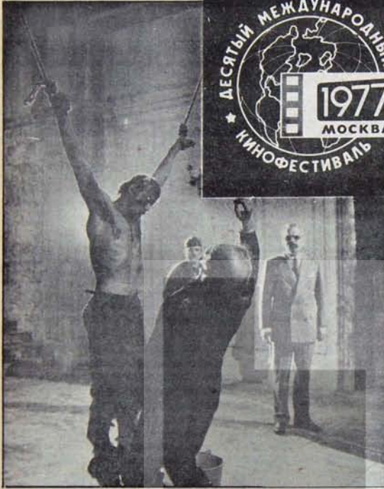
BUYUK ÖDÜL ALAN "BEŞİNCİ MÜHÜR" DEN BİR SAHNE

Yirmi yıldan bu yana her iki yılda bir düzenlenen Uluslararası Moskova Film Şenliği bu yıl 7 - 22 Temmuz tarihleri arasında yapıldı. Dünyanın en önemli sinema şenliklerinden birisi olarak kabul edilen Moskova Film Şenliği'ne bu yıl tam yüz ülke katıldı. Bu ülkeler arasında adını duyurmayla pek alışmadığımız Yukarı Volta, Somali, Çad gibi ülkeler de vardı. Belki de sadece bu niteliyle Moskova Film Şenliği dünyanın en önemli şenliği olarak nitelendirilebilir.