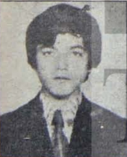
FAŞİSTLER TARAFINDAN ÖLDÜRÜLDÜ

Bu kadar geniş sayıda öğrenciyi barındıran bir yurt, elbette ki sermaye iktidarlarının ilgisinden uzak kalamazdı. Onlar da ilgilendiler. Yurdun açılışından bu yana, hazırladıkları bir planı adım adım uygulamaya koydular.