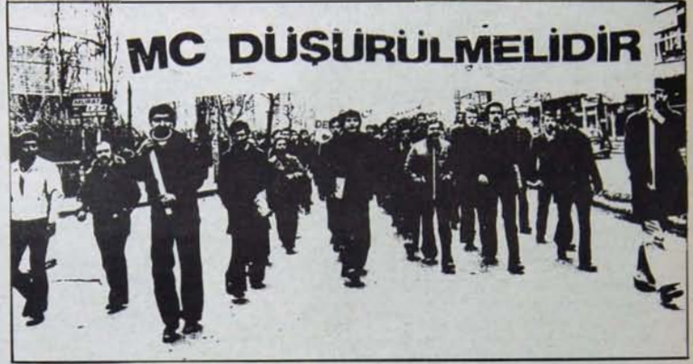
Program, MC karşısında CHP'nin tarafsızlaştırılmasını öngörmektedir:

Milliyetçi Cephe'nin elebaşları, işçi ve emekçi kitleler arasında "yeni, bugünkünden değişik, sömürsüz ve mutlu bir Türkiye" özleminin ne kadar derin olduğunun farkındadırlar. Bu özlemin ve kitlelerin artan mücadeleciliğinin önüne set çekebilmek, yanlış kanallara yöneltebilmek için emekçi halkın belli taleplerine cevap verir, bugünkünden farklı bir Türkiye özlemini sahip çıkar görüntümüne girmekte, faşist planlara kitle tabanı sağlamaya çalışmaktadırlar. Geri ve bağımlı Türkiye kapitalizmi çerçevesinde verilebilecek tavizlerin sınırlılığı ve buna dayalı görüntülerin geçiciliği ise, ikinci yöntemle, dini inanışların burjuvazinin politik çıkarları için kullanılmasını, bilimsel olmayan görüş ve açıklamalara mümkün olabilen en büyük yaygınlık ve etkinliğin kazandırılması yöntemine kapatılmaya çalışılmaktadır. Milliyetçi Cephe programında yer alan ve özellikle küçük üreticilere ve kapitalizmin güvenli bir hayattan yoksun ettiği yaşlı, işsiz, muhtaç kişilere yönelik vaatler bu yöntemlerin bir belirtisidir. Yine Türk Ceza Kanunu'nun 163. maddesi ile ilgili açıklamadan imamet hatip okullarına, eğitim sistemine ve camilere kadro tahsisine kadar birçok vaat, temelde aynı ideolojik saldırdın göstergeleridir.