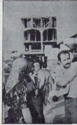
GÖREV SATAN TIP'LILER: ENGELLERİ AŞTILAR, AŞAÇAKLAR

Aslında CHP Genel Başkanı Ecevit, CHP'li parlamenterlerin içlerini boşalt-