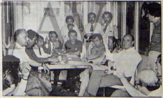
VAKIF KURUCULAKI BİR ARADA