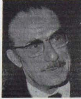
NİHAyet CİDDİ BİR İŞ BULDU