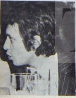
TRT'NİN GERÇEK GENEL MÜDÜRÜ

CHP, her neyse kamu oyunu etkileyen araçlarla çok yakından ilgileniyor. Hükümet organlarının da bu araçlardan yararlanmasını istiyor. CHP Hükümeti zamanında bazı bakanlıklar bu konuda adımlar attı ve kuruluşlarını, bazı ajanslara abone etti. Güvenoyu alabilirdi takdirde bu uygulamanın MC Hükümeti zamanında da devam edeceğine kuşku yok.