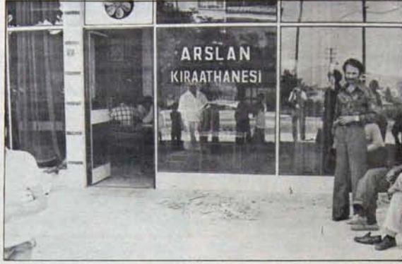
FASİSTLERİN İLK SALDIRISI DEĞİL

Gün geçmekizin yinelenen bu saldırıların bir öğrenim kurumunda kaynaklanmasa, olayın yalnızca dışarıya yansın yönlendirilmedi. Temeldeki neden ise MC eylemleri sürdürülen eğitim ve öğrenim kurumlarını faşistleştirme politikası. Bu, yalnızca Atatürk lisesi olaylarında da gö-