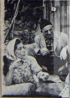
BASKALARI "BOĞAZ SEFASI" SÜRERKEN

İstanbul Boğazı denince hemen herkes aklına doğal güzellikler ve zenginlikler gelir. Boğazın sirtlarını boydan boya tenekte damlı, tek odalı gecekonduların doldurduğunu ve bunların sayısız sorunlarını, buralarda oturanlardan başka bilen pek yoktur. Bugün bu gecekondularda oturanlar, ikili bir "afet"le karşı-