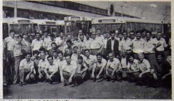
YALNIZCA "HAK GREVİ" MI!

İşte emme basma tulumba böyle işliyor. "Çiftlik gibi yönetmek" gibi bir söz vardır. Türkiye de hiç bir çiftliğin böylesine başboş bir biçimde yönetildiğine biz inanmıyoruz.