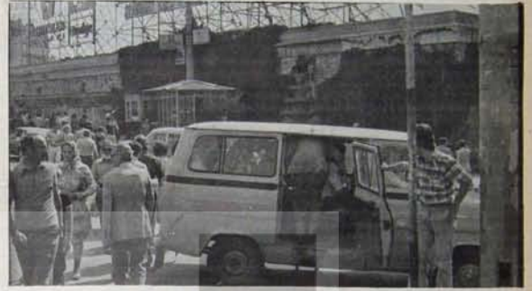
KİMLERİN OYUNUNA KURBAN GIDIYORLAR?

"Tencere dibin kara, seninki benden kara" diye birbirlerini yemeye çalışan İstanbullu Halk Partililer tepişirken, olan halka ve ganster sendikacıların elinde oyuncak olan işçilere oluyor.