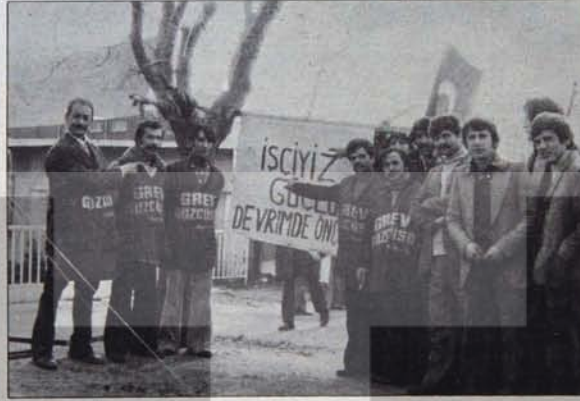
İŞÇİ SINIFI MESSE'YE BOYUN EGMEYECEK

Bilindiği gibi dayanıklı tüketim malların üretimi son yıllarda en hızlı gelişmeyi gösteren sektörleri oluşturuyor. Bu sektörlerin belirgin niteliklerinden biri, dışa bağımlılığın önemli boyutlara ulaşması. Herşeyden önce, bu alanlardaki işletmelerin girdilerinin önemli bir bölümünü yurt dışından sağlıyorlar. Örneğin, otomotiv sanayiiinde ithal girdi oranı % 50 dolayında. Televizyon üretiminde de benzer bir durum söz konusu. Bu du-