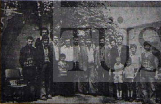
İŞÇİSİNİFİ TEHDİDE PABUÇ BIRAKMIYOR

4. Bölge'nin işçileri, bilinçli disiplinli çalışmalarını dayanışma içinde sürdürerek, kendilerine empoze edilmek istenen sınırlamaları ve kof çökme bir yöneticiyi reddettiler. Güvenlikten ve inandıkları bir işçiyi başta getirdiler. 4. bölge işçilerinin dikkatli, bilinçli, uyanık ve tehdite boyun eğmez tutumlarını bundan böyle de sürdürecekleri kuşkusuz.