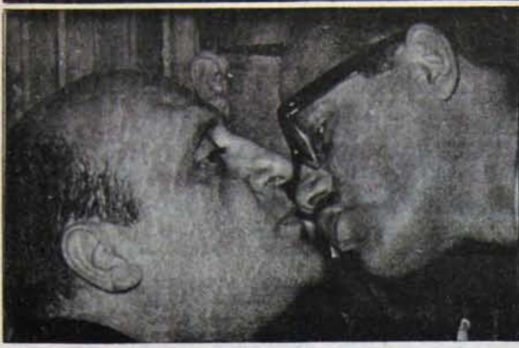
BİR İHTİMAL DAHA VAR