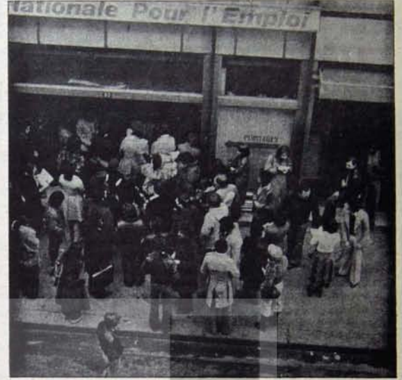
İŞSİZLİK: SOSYAL DEMOKRASİNİN ÇÖZÜM BULAMADIĞI DERTLERDEN...

Sosyal demokrasinin tarafından izlenen "reformlar politikası", bugünkü bunalım koşullarında, kapitalist sisteme kök salmış gerici eğilimler tarafından pratikte etkisiz hale getirilmiştir. Birçok sosyal-