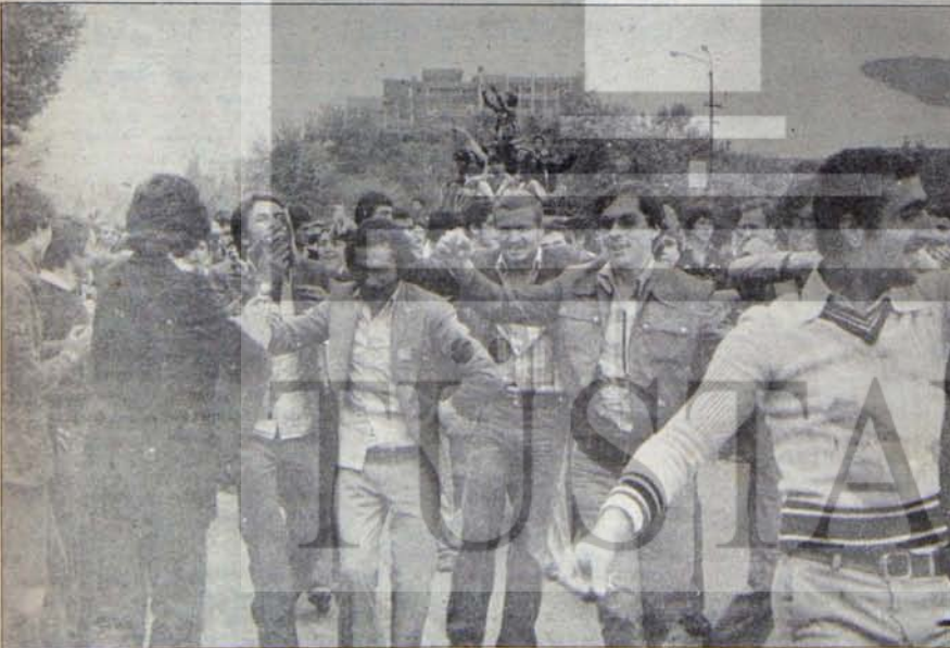
BUSEVİNÇ BOŞA ÇIKARILMAMALI

Ecce'it'e kulak vermeden şu hususları bilmek daha yararlıdır: