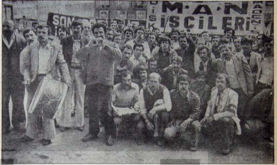
KARŞILARINDAKİ CEPHEYİ İLKELİ MUCADELE İLE YENEBİLİRLER

Greve katılan işyerlerini iki bölümde toplamak mümkün. Birinci bölümde yer alanlar genellikle KOÇ grubuna dahil ve