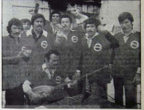
EKONOMİK MÜCADELEDE DÜŞMANI İYİ TANIMAK GEREKİR

Bir diğer yan daha var. Bu ikinci yan, çalışma hayatımızın denetlenmesiyle ilişkilidir. MESS doğrudan uzlaşma kurullarını, özel hakemleri, uyuşmazlıkları çözümler ve ilk hakem kurullarını denetliyor.