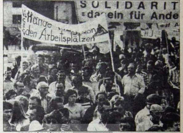
TEKELCİ KAPİTALİZM KİTLELERİ AÇLIĞA MAHKUM EDİYOR

Kapitalist ülkeler yöneticileri yanyana geldiklerinde iyiniyet açıklamalarını esirgememekte, ancak uygulamaya sıra geldiğinde kendi aralarındaki çelişkilerin savunucu etkisiyle dağılmaktadırlar. Gelişmiş kapitalist ülkelerin yöneticileri ikinci dünya savaşından sonraki bütün