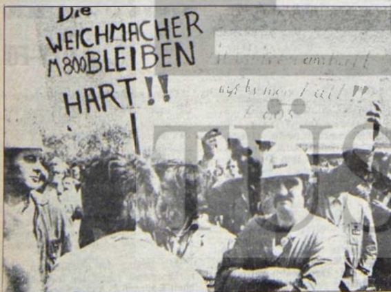
ENFLASYON VE İŞSİZLİK BİR ARADA

Birleşik Amerika ve onun en yakın müttefiki Federal Almanya, diğer gelişmiş kapitalist ülkeler karşısındaki görece üstünlüklerini bu ülkelerin kendilerine politik bakımdan daha çok bağımlı hale getirmek için kullanmaktadır. Tekelci sermaye dünyanın her yerinde işçi ve emekçi kitlelere karşı gerici ittifakları oluşturmakta, bu ittifakları pekiştirmek için bütün olanaklarını seferber etmektedir. Fakat bu ittifakların da kapitalizmin çelişkilerini çözmesi ya da yumuşatması olanaksızdır. Kapitalizmin derinleşen bunalımının çözümü tekellerin baskı ve tahakkümünden kurtulmuş bir toplumdur, sosyalizmin yolunu göstermektedir.