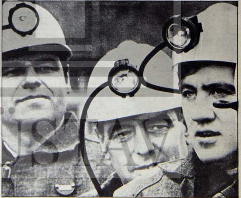
SOSYALİST SİSTEMİN İNSANLARI GELECEĞE UMUTLA BAKIYOR

Savaş sonunda gerici Batı basını "kızıl tehlike", Kızıl Ordu'nun süngüleriyle yapacağı "devrim ihracı"