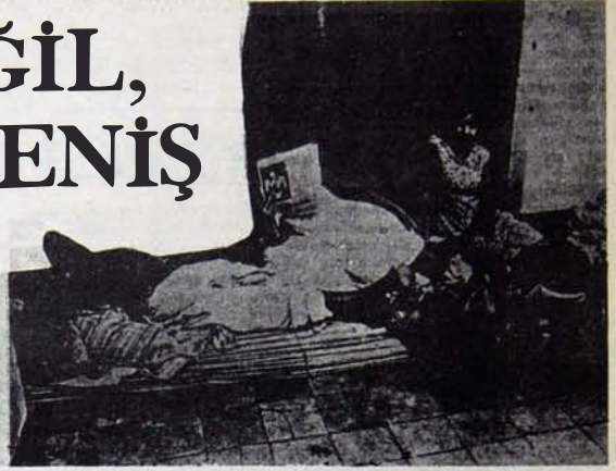
SOMURU VE SEFALETİN KAYNAGINDA EMPERYALİZM VAR

- Son Paris Konferansı, emperyalizmin özellikle 1973'te patlama noktasına gelen bunalımı çerçevesinde ele alınmalıdır. Çeşitli ülkelere yöneltilen silahlı saldırılar, Afrika'nın çeşitli bölgelerinde karşılaşılan müdahaleler, bu bunalımın askeri ve politik belirgi biçimleridir. Ekonomik, politik, askeri boyutları ile Londra Zirvesi bu değerlendirmeyi yapmıştır. Tüm öteki girişimleri gibi emperyalizmin bu Kuzey-Güney diyalogu girişimi de direnen halkların bilinçli mücadelesi ile boşa çıkarılacaktır.