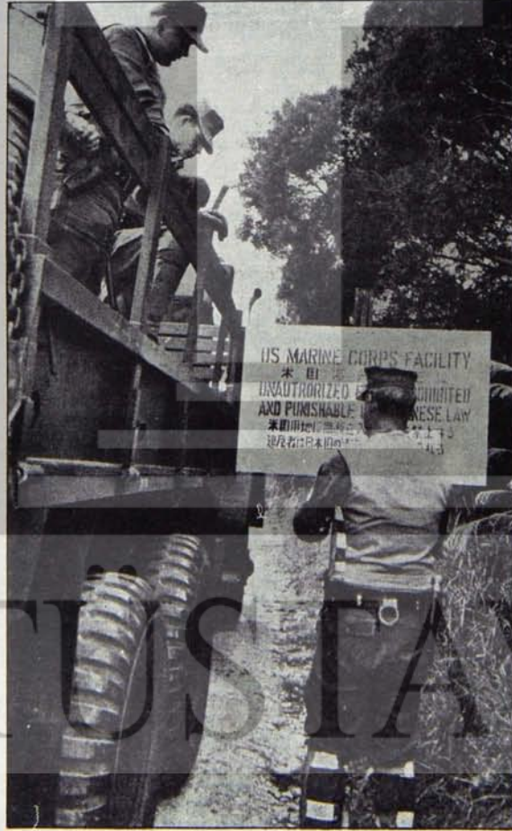
"DAHA ÇOK SÖMÜR"ÜN VURUCU GÜÇLERİ

ve sosyal farklarla ayrılan ülkeler, ortak taleplerle bir çeşit cephe oluşturuyorlar. Bu gelişme karşısında emperyalizm ilkin sert bir tavır alıyor. Kissinger'in öncülüğü ile Uluslararası Enerji Ajansı kuruluyor. (Ulusal kurtuluş savaşının mirasçısı CHP Türkiye'yi bu Ajans'a balıklama sokacaktır.)