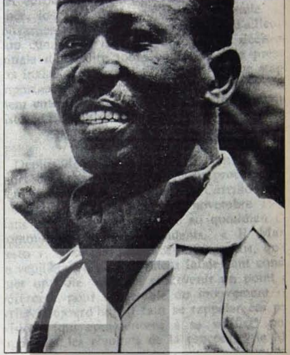
ETIOPYA'DA İLERİ ADIMLAR

Etyopya'ya içinde bulunduğu süreçten geri çevirmek isteyen güçler arasında eski velleht prens Asfa Wossen'in bulunduğu Etyopya Demokratik Birliği adı büyük toprak sahipleri ve feodal aristokrasinin temsilcisi örgüt de var. Bu örgütün karşı devrimci eylemler arasında köylü hareketi önderlerine karşı saldırı-