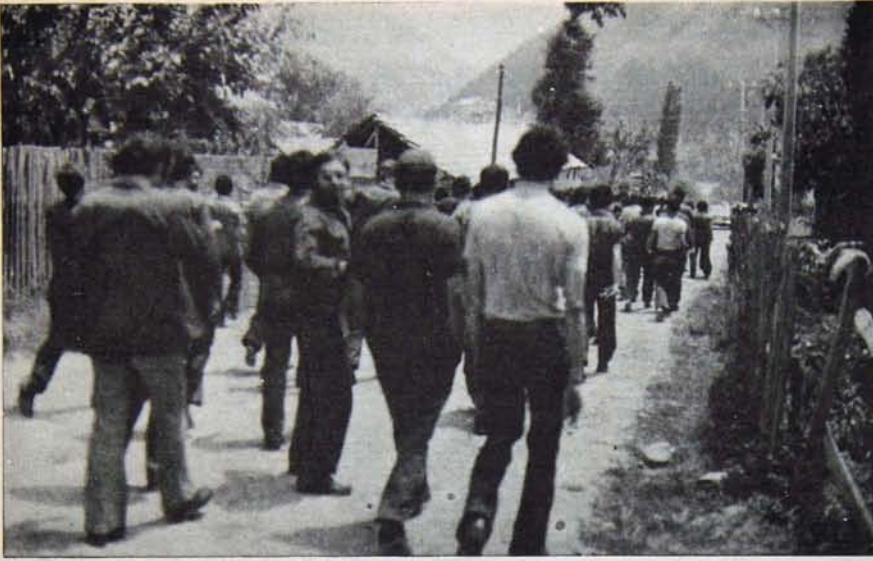
BURSA İŞÇİLERİNİN KARŞISINDA ÖYLEBİR VALİ VAR KI..