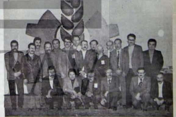
TIP, MYK UYERLERİ TOPLU HALDE