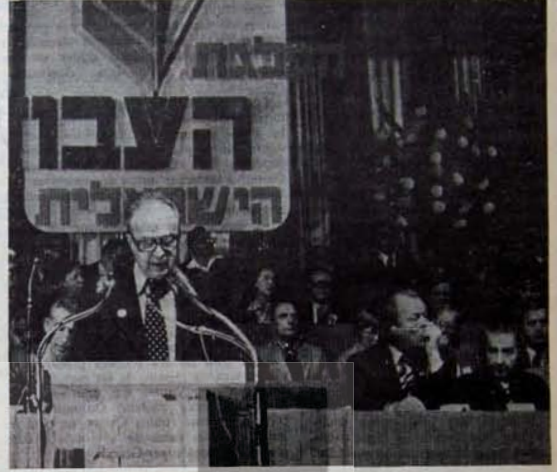
RABIN VE SOSYAL DEMOKRATLAR

Ekonomik ve politik bunalım İsrail'i dört bir yandan kavramış durumda. Resmi fiyat endekslerine göre tüketim maliyetlerindeki artış 1976'da %38'e ulaştı. Maliye Bakanı Rabinowitz'in bu oranı %27-28'de tutma yolunda yaptığı vadeleri ilerici çevrelerde seçim yatırımı olarak niteleniyor. İsrail, ulusal ürünün %40'ını askeri harcamalara ayırıyor. Bu oranla, dünya ülkeleri arasında başta geliyor. Bu orana ulaşabilmek için Sağlık,