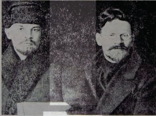
KALININ, LENİN İLE BİRLİKTE

(* M. I. Kalinin, Devrimci Eğitim Devrimci Ahlak , Ser Yayinevi, Aralık 1976, 257 sayfa, 20 lira.