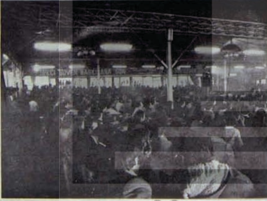
DELEGELER KOLLEKTİF BİLİNCİ YAŞANMAYIYOR

Birçok delege, CHP'nin niteliği üzerinde durdu. Bu konuda konuşan tüm delegeler, CHP'nin ikili niteliği üzerinde birleştiler. CHP'nin bir yanıyla büyük burjuvaziye güven vermeye yönelik politikası, diğer yanıyla da onu diğer burjuva partilerinden ayıran özellikleri, Çalışma Raporunda ve Genel Başkan Behice Boran'ın konuşmasında ayrıntılı bir biçimde ele alınmıştı. Delegelerin konuşmaları, bu değerlendirmelerin hareket ederek, bazı sorunları vurgulamaya yönelik oldu.