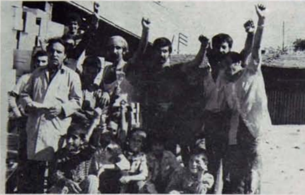
IRMAK DETERJAN İŞÇİLERİ: YARDIM ALAMIYORLAR

16 Eylül'de başlayan işçi direnişlerine kimlerin sahip çıkıp, kimlerin çıkmadığı gün geçtikçe ortaya çıkıyor. İşçiler, direnişe sahip çıktılar. Binlerce işçi işten atılmayı göze aldı. Direndiler ve direnenlerin binlencesi işten atıldı. Şimdi çoğu aç ve açıkta.