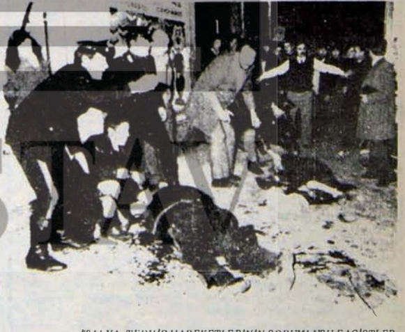
İTALYA: TEDHİŞ HAREKETLERİNİN SORUMLUSU FAŞİSTLER

"Gericiğin deney küresi, Kıbrıs halkının kanını başına sıratıyor."