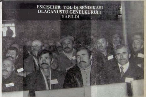
YOL-İŞ EMEKÇİLERİ: CEPLERİNDE KİMİN ELİ VAR?