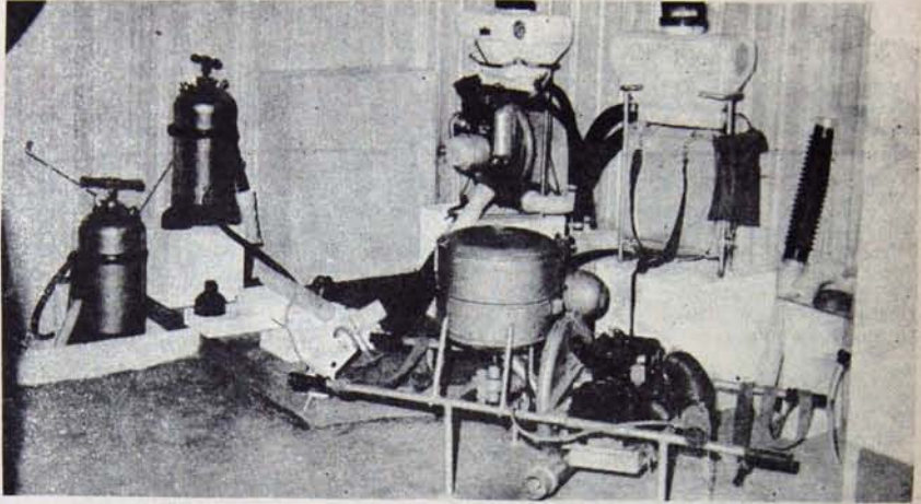
ÜRETİM ERİNDE KULLANILAN MOTORLAR NASIL GETİRİLİYOR?

Bunun üzerine satınalma komisyonu 365 ton elektrolitik mangan dioksitin "Mitsubishi" firmasına siparişini öne- riyor. Ama İktisat Müdürlüğü bir de, Kim- ya Sanayi Dairesinin görüşünü almak istiyor. Bu dairenin görüşü şöyle: "Her iki firma teklifi de şartnameye uygun.