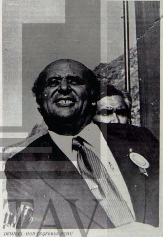
DEMİREL, HOR TEŞEBBÜS RUHU