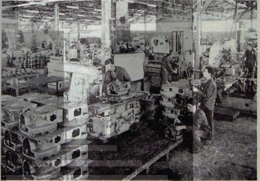
HERKESTEN ÖNCE ONLAR ANLAYACAK

İşin daha da ilginç yönü şu: İhalenin verildiği "Röchling" firması kuruma sattığı malzemeleri gene bu ihaleyi teklif eden ama teklifinde "Kullanma amacına uygunluk" garanti etmemiş olan bir başka firmadan, "Hoesch" firmasından alıp, kuruma satıyor. "Hoesch" firması da bu durumu temsilcisi aracılığı ile kuruma