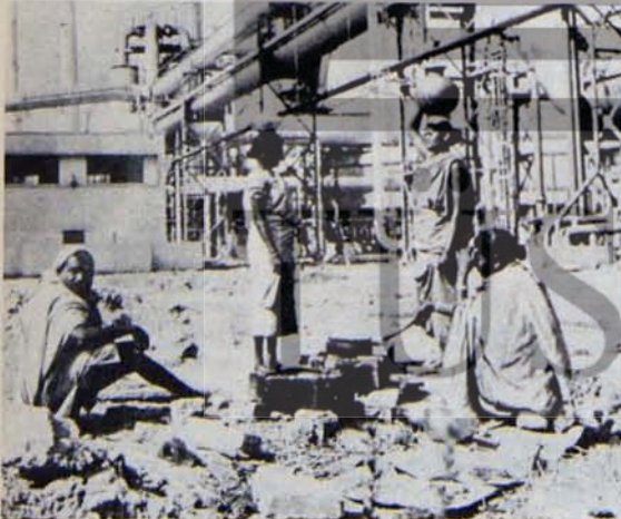
"HİNDİSTAN KORKUNÇ BİR SEFALETİN ÜLKESİDİR"

Elbette Fransa ve Hindistan'daki durumları özdeşleştirmek basiti bir yaklaşım olur, ancak eylemlerimizin sınıfsal temeli aynıdır. Bizim dayanışmamızı güçleştiren de budur."