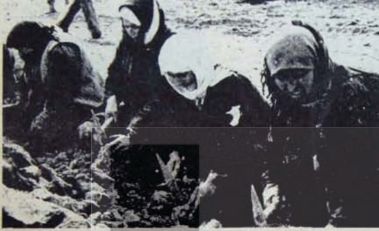
KADIN OLARAK, ÇİLELERİ ARTIYOR