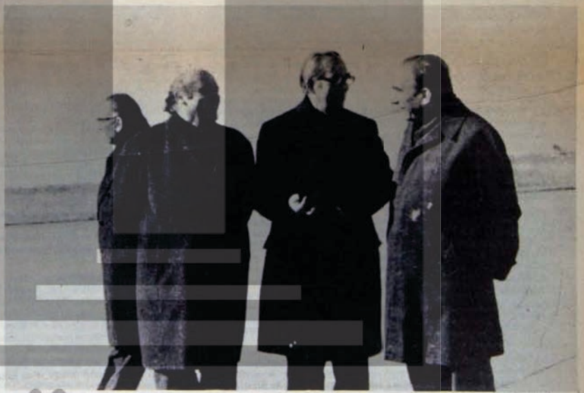
CEPHE ORTAKLARI İRAK CUMHURBAŞKANINI ADANA'DA BEKLERKEN "HER ŞEYE RAĞMEN GÖREVİMİZ SOSYALİZMİ ONLEMEK"

Milletvekili maaşlarına yapılan bu zam az da olsa var olan erken seçim