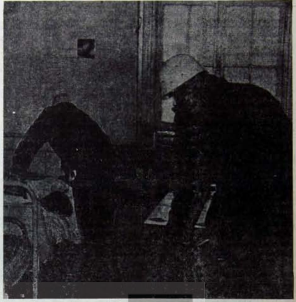
"ARAMA" BAHANESİ İLE YILDIRMA ÇABALARI