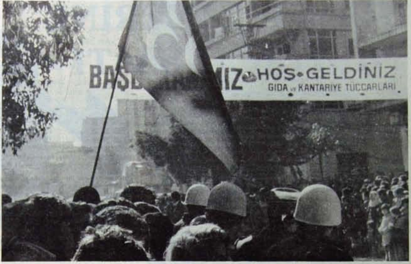
ÇU HİLAL BAYRAKLAR ALTINDA KUTLANAN ADANA'NIN KURTULUŞ BAYRAMI