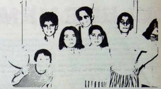
DAHA ÇOK KAR İÇİN DAHA UCUZ EMEK

de çalıştırılır. Asistanlarla karşılaştırıldığında, yaptıkları iş o kadar aynadır ki, bir internin çalışması durumunda yerine bir asistan konulur. Bütün bunlara karşılık, bir asistan ayda net 5.600, TL alırken, bir interne 598, TL ödenir. "Harçlık" adıyla. Hastanelerdeki internler, bu şekilde ucuz emek kaynakları olarak kullanılırlar. Ancak bu sömürünün yasal kılıfı da belirgin değildir. Örneğin bir intern'in herhangi bir ek işi olduğu zaman adı listeye "çıkışı özeti" eksik olan d'lar' olara yazılır. Ama eğer ödediği harç gecikmişse, "öğrenim harcını ödemeyen 6. dönem öğrencileri" olarak anılırlar. Yani, işe gelirse doktor, gelmezse öğrenci.