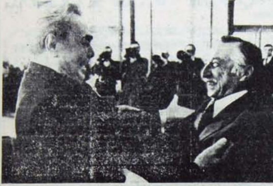
BREJNEV-CORVALAN: ÖZGÜRLÜK SAVAŞÇILARI