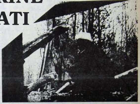
SIRTLARINDAN MİLYONLAR KAZANMAK İSTEYENLER VAR