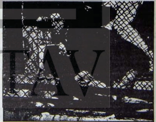
"ŞİLİ'DE DAHA BİNLERCE TUTUKLU VAR"

Luis Corvalan sözlerini şöyle tamamladı: "Zulme son veremey ve gerçekten halkı temsil eden bir hükümetin kurulmasını, bir yurtseverlik botcu olarak kabul ediyoruz."