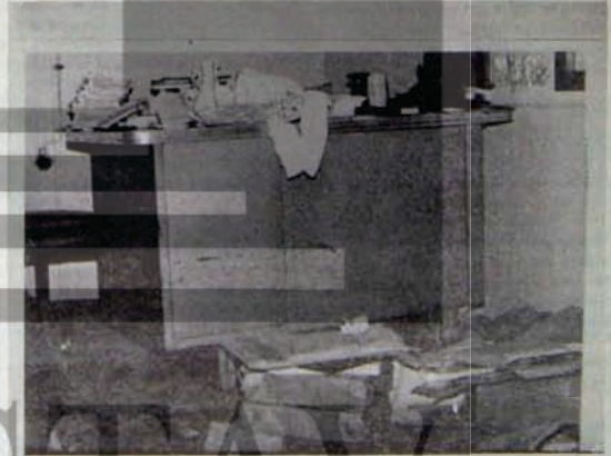
SPOR ÇIKARCILARI HINÇLARINI BOYLE ALDILAR

Yeni yılın 4. günü derneğe geldiğimizde içreng bir duruma karşılaşıcağıktık. Dernek binasının lüm kiremitleri yerde, kapı kırılmış, eşyalarımız, derçiler, euraklarımız yerlerde idi. 2 anı polis nezaretinde dernek didik didik oranmış, duvarda asılı spor ağıfleri bile parçalanmıştı. Dergi hışgeleri paramparça edilmişti. Sözde sayım yapılmıştı. Emir in yüzsek yerden geldiğini