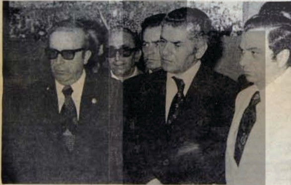
FEYZİOĞLU'YA NELERDE ORTAK!

Türk-İş'te, Teksif genel kurul sonuçları kesin biçimde AP listesini yönetime getirirken, işçi kıyımı konusunda CHP kilimi kıpırdatmazken CHP Genel Başkanı Bülent Ecevit'in "DİSK ve Türk-İş tabanlarının yüzde 80'i CHP'lidir" demesi bir hayli ilginçtir. Ama CHP yönünden "ne hakla ve hangi yüzle" sorusuna verilecek bir cevap olmalıdır.