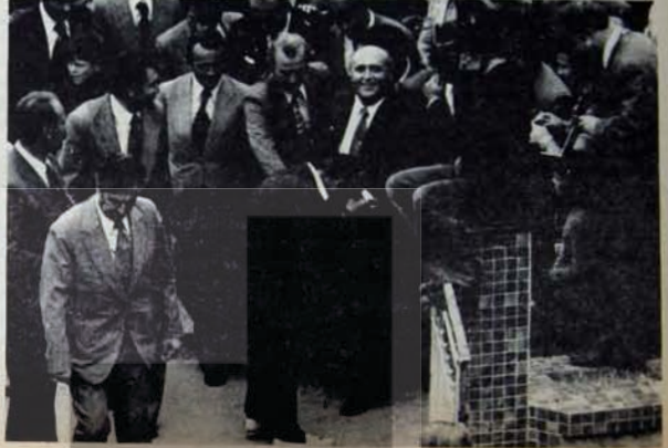
TEMEL YARIŞI SURUYOR...

başlamıştır. Devlet Planlama Teşkilatı tarafından hazırlanan "Önemli Projeler" raporunun 30 Nisan 1976 tarihisinde, Kırka Bor türevleri tesisleri için 30 Nisan tarihine dek 42 milyon lira harcandığı belirtilmektedir. Yine Demirel tara-fından temel atılan II Petro Kimya Tesisleri aynı rapora göre, 1972 yılında programa alınmış, 1976 yılında tamamlan-ması planlanmıştı. Ancak daha sonra bitiş tarihi 1979 yılına ertelendi. İlk he-saplara göre tamamlanması gereken 1976 yılında Başbakan Demirel, tesisle-rin bir kez daha temelini attı. Oysa 30 Nisan 1976 tarihine dek II. Petrol Kimya için 224 milyon 798 bin lira har-candı.