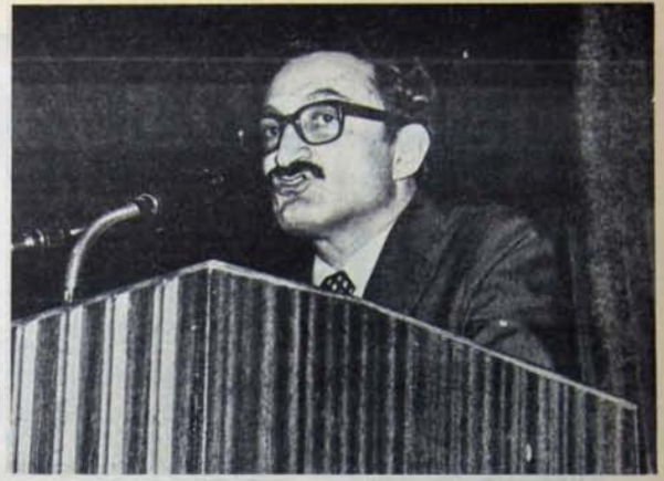
ESKİ PAŞACILARI MEMNUN EDİYOR