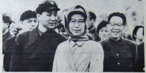
KARGAŞA ONLARLA BAŞLADI

Diğer yandan, Zimbabve'deki ulusal kurtuluş örgütlerinin liderleri, emperyalizmin süreli başkalarını ve Smith arkadaşlarının saldırılarına karşı silah mücadelesinin sürdürülmesinin zorunu olduğunu, yoğunlaştırılması için gerekli araçların incelendiğini de bildirdiler.