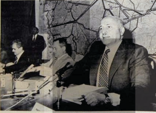
ATTIĞI "TEMEL"LER BAĞAJDA TAŞINIYOR

Demirel bugün aynı şeyleri düşünüyor mu? Bu soruya en azından "dünkü parlaklıkta değil" cevabını vermek mümkündür ve AP kurnaylarını kara düşündüren olay da budur. CDP oylan tamama yakın CHP'ye kapılmış, DP oylanından hiç umulmadık fireler gene CHP'ye verilmişti.