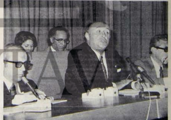
GENSCHER'E NELER SOYLEDİ!

İki büyük ortak arasında Sivas'taki 4. Demir Çelik tesisleri temelinin atma konusunda hatun sayılır bir patırku kopmuş, Demirel "Ne sen ne ben, gel bunu