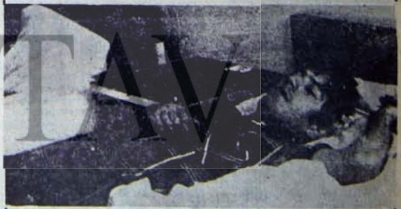
Kan dökmeye, MSP elinden geleni yapıyor.

Bundan sonrası herhalde AP'nin büyük başlarının müdahale etmesi gerekecek.