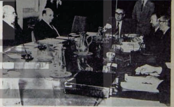
Denktaş, akıl hocaları arasında

Klerides'in seçim kampanyası Ankara'da ve Kıbrıs'ın Türk kesiminde "başarıyla" sürdürüldü. Bağımsız Türk devleti tezini ne denli yaklaştığı, çeşitli açıklamalarla kamuoyuna bildirildi. Tez'in haklılık kazandığını, "saygın ve genellikle ılımlı bir Türk gazetesi olan yüksek tirajlı Milliyet" yazdı. Milliyet'teki bu yazı ve Milliyet'te ilgili bu değerlendirme, Ağos gazetesinde yer aldı. Yazının Türk ve Yunan hükümetleri tarafından dikkate alınması istendi.