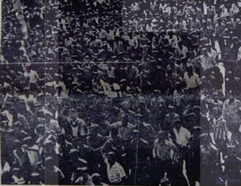
Elazığ'da fitili ateşleyen MSP oldu.

MSP'nin Doğu'ya girme çabalarının bir başka aracı da, MSP güdümündeki sendikalar. Daha önce YURUYÜŞ'e çeşitli vesilelerle açıklandığı gibi, Diyarbakır'da işçiler üzerinde sürdürülen baskı ve kıyımların başlıca aracıları MSP güdümündeki Ça Tekstil ve Ça Yol iş sendikaları. Bu sendikaların karayolları teşkilatında ve Diyarbakır İplik Fabrikasında sürdürüldüğü politika YURUYÜŞ okurları tarafından biliniyor.