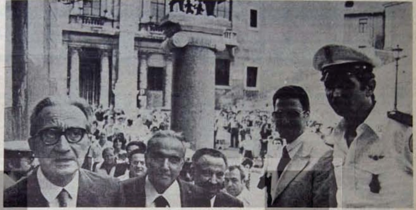
Roma Belediye başkanı, yardımcılar ile birlikte.

ROMA'NIN İKP LİSTESİNDEN SEÇİLEN YENİ BELEDİYE BAŞKANI: "SANAT TARİHİNDE BENİMSİDİĞİM METODOLOJİ MARKSİST METODOLOJİDİR. ROMA'NIN TARİHSEL BİR MERKEZ OLMASI KONUSU, YALNIZCA YAPILARIN KORUNMASI KONUSU DEĞİLDİR. SORUN, BU "TARİHSEL MERKEZ"İ, KENTİ YAŞAYAN GERÇEKLİĞİ İÇİNE YERLEŞTİREBİLMEKTİR. BAŞKA BİR DEYİŞLE ŞUDUR: KENTİN HAKIKİ KARAKTERİNİ, GERÇEKLİĞİNİ KORUYABİLMEK İÇİN, HERŞEYDEN ÖNCE ONUN TOPLUMSAL İÇERİĞİNİN DEĞERİNİ VERMEK, ORADA ÖTEDENBERİ YAŞAYAN HALKI KORUMAK VE BUNUN İÇİN DE SPEKÜLATÖRLERİN SALDIRISINDAN KURTARMAK GEREKİR."