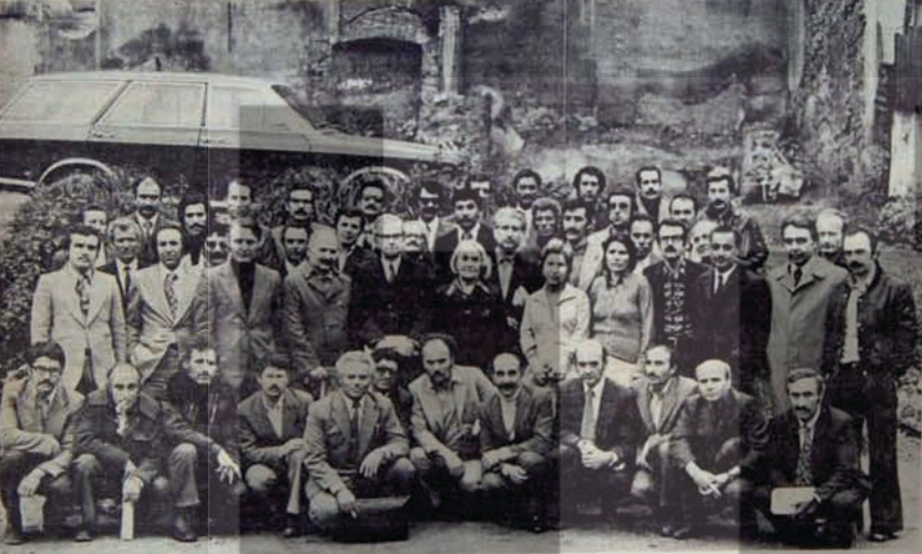
Örgütlenme kampanyasını başarı ile sürdüren ve seçimlere katılma hakkını elde eden Türkiye İşçi Partisi, kurucuları partinin kuruluşu sırasında toplu halde...

Bunun bir parçası olarak DISK'e karşı da yeni tehditler yöneltilmektedir.