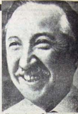
"Hayatı seviyorum. Fakat hayatımı adağım dava için ölmek gerekirse ölmekten de korkmam."

rimci dönüşümler için mücadele halkın çoğunluğunun işçi sınıfı çevresindeki birliği için öne sürülen bir plandı. Corvalan 1969 Ekim'inde yapılan Parti'nin