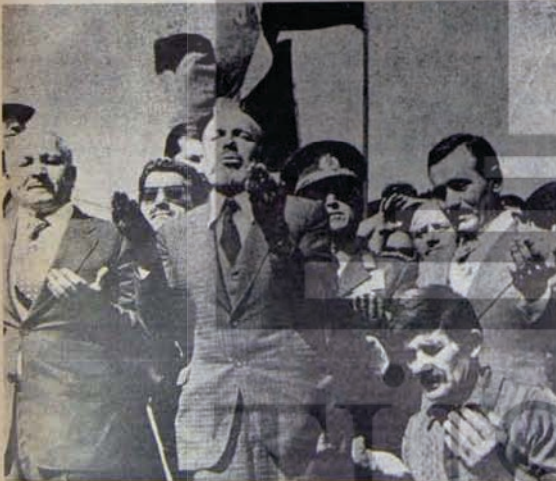
163. maddenin şikayetçileri

Geçtiğimiz haftalar içinde bağımsız Muş milletvekili Kasım Emre'den AP