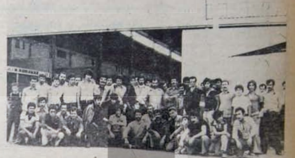
Direnışteki hal emekçileri toplu halde

Tümü de sigortasız. İş ve yaşam güvenliğinden bütünü ile yoksunlar. Patron istediği anda işlerine son verebiliyor. Ya da türlü kaza ve sakatlıklar sonucunda çalışamaz hale geliyorlar.