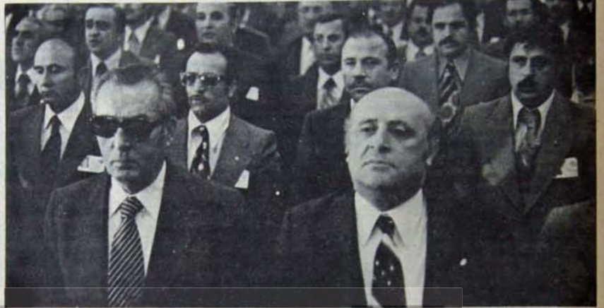
Nüans tartışması, suç ortaklığını temizleyemez