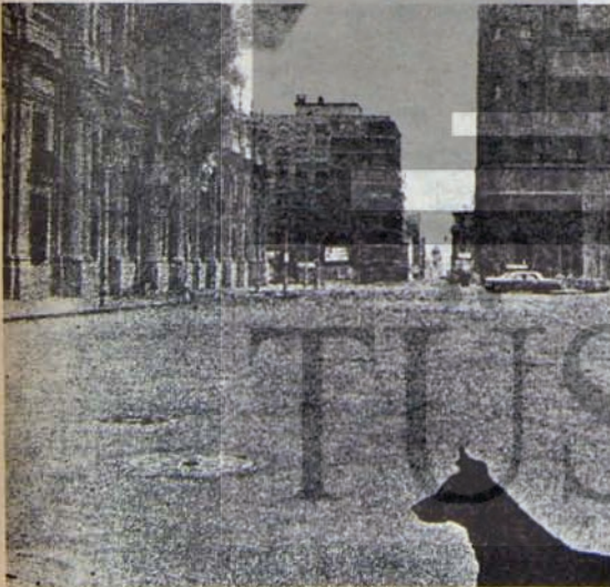
Başkanlık sarayı saldırı altında

lerin sarayı terk ederek ülkede istedikleri biryere gitmelerini önermişlerdi. Allende sarayı kazanım son damlasına kadar savunacağını açıkladı. Saraydaki diğerleri de aynı görüşteydi. Direniş devam edecekti.