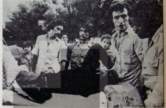
Emperyalizmin kurbanı olmamak için...

erişme durumları. Bu, kapitalist olmayan yol sürecinin kimlerle hangi ölçülerde izleneceğini belirleyen önemli bir kıstas. Bu kıstas, bugün de kuramın uygulanma kapsamını belirliyor. Burjuvazi ve proletaryanın, gerek güçleri, gerekse siyasal olgunlukları açısından, toplumda ön plana çıktığı ülkelerde, sosyalizmi hedefleyen bir süreç olarak geçiş aşamalarında, proletaryanın hesin belirleyici güç olacağı ortaya çıkıyor. Küçük burjuvazi ya bu belirleyici gücü izleyecek, ya da burjuvazi ile birlikte karşı devrim safılarında yer alacak. Başka bir