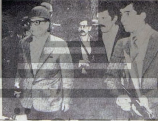
Allende ve muhafızları sığırları ile kapıya ilerliyor.

"Saat 11.45'de Başkan Allende kızlarını ve saraydaki tüm kadınları toplayarak La Moneda'dan ayrılmalarını istedi. Vurulmalarından endişe ediyordu. Kadınların çıkarılması için saraya saldırılarından çarpışmaya 3 dakika ara verilmesini istedi. Faşistler bunu reddettiler. Ancak o sırada, hava saldırısına olanak sağlamak için yaya birlikleri geri çekiliyordu. Anlık ateşkestlen yararlanılarak kadınlar saraydan çıkarılabildi.