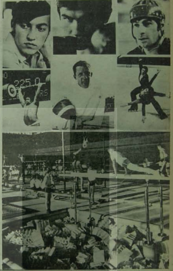
Cephe'nin Bakanı, Sosyalist spor anlayışını övüyor.

Sovyetler Birliği'nde sanayi, tarım ve kültür alanlarındaki başarıların yanı sıra