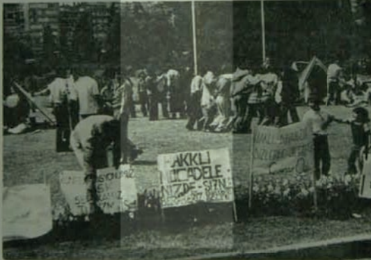
Turizm-İş: Sermayenin ve figüranlarının oyunu boşa çıkarılacak.

Yürütme Kurulu toplantısı sürüyor. Bu arada, DISK'e bağlı bir sendikamız binasında, 12 Mart öncesi gözışını ve