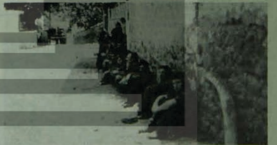
BURSA İŞÇİLERİ YENİ TAHRIKLER KARŞISINDA

Tüm bunlar işçilerin direncini kırmaya yetmiyor. Mücadelelerini Turizm İş sendikasına geçinceye kadar sürdürecekler.