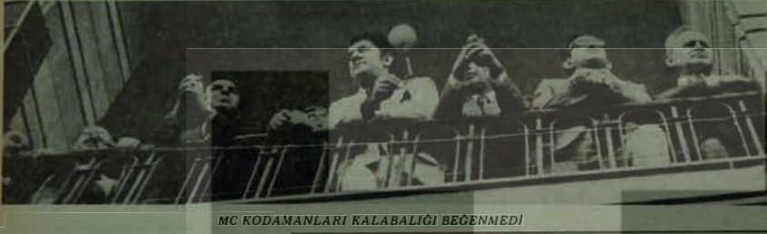
MC KODAMANLARI KALABALIĞI BEĞENMEDİ