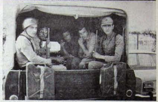
SALDIRIYA UĞRAYANLAR GÖTÜRÜLÜYÖR