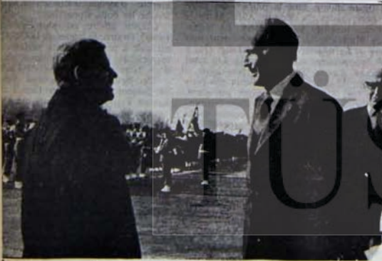
GISCARD - SCHMIT : NE KONUŞUYORLAR

"Partilerimiz arasında böyle bir anlaşmaya varılmasının, ülkemizde güçlü bir halk atılımına yol açacak nitelikte olacağına inanıyoruz. Böyle bir anlaşma, partilerimizin tümünün birçok belediye kazanmasına ya da birçok komündeki durumlarını güçlendirmesine, böylelikle emekçilerin çıkarma bir belediye politikasını hep birlikte uygulamasına olanak verebilecektir. Böyle bir mutabakatın yalnız kısa dönemde değil, gelecekte de geniş bir çerçevede önemli olacağına eklemeliyim. Bize göre, partilerimiz arasında varılacak böyle bir anlaşma 1978'deki seçim dönemi üzerinde ağırlığını duyuracaktır. Bugün varileceğimiz anlaşma birliğimizin güçlendirilmesinin, kamu işlerini açık bir anlayışla hep birlikte yönetme yeteneğimizin örneğini vermek için iyi de bir vesile olacaktır."