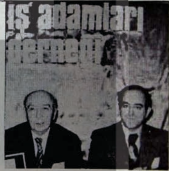
HERŞEY ONLAR İÇİN

Genel tüketim maddeleri içinde ağırlığı en fazla olan gıda maddelerindeki artış hızları ise izlenmesi güç düzeyde gerçekleşti.