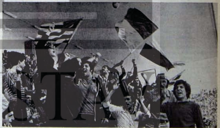
SAHALARA NASIL GİTİRİLİYORLAR?

Toplumsal bir olgu olarak ortaya çıkan spor, doğaldır ki yürürlükteki sistemle çok yakından bağlantılıdır. Bu açıdan bakınca da spor hem sınıf mücadelesinin verildiği bir alan, hem de sınıf mücadelesinde si-