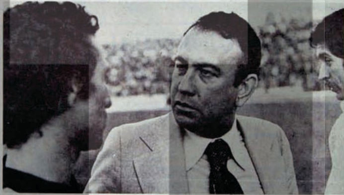
YEŞİL SAHALARDA, KAR PEŞİNDE

Sporu, toplumsal yapıya bağlayınca sporla politika arasındaki ilişkiye de değinmek gerekiyor. Sınıf mücadelesi gereği spora belli bir önem tanımak, kitle örgütlerinden bu konuya eğilmelerini istemek gerek. Bu konuda sosyalist ülkelerin spor anlayışına eğilmek son kerte öğretici. Ancak, burada amaç, sporun, özellikle uluslararası yarışmalarda ortaya çıkan politik yanını vurgulamaktır. Sporun tarafsız, sınıflar üstü, partiler ve rejimler üstü olduğunu iddia edenler, onu kendisi siyasal amaçlarını gerçekleştirmede bir araç olarak kullanmışlardır. Musolini ve Hitler'in gençliği