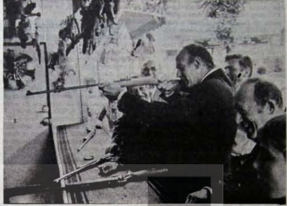
GISCARD: HEDEF SOSYALİZM..