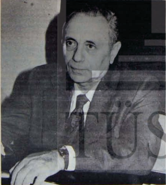
"ATININ BACAĞINI KIRAN SEYİS"

Bütün bunlar varken, Ecevit'in raporla ilgili demeçleri ve Parti Meclisi'nin son bildirisi havada kalıyor. Ancak havada kalana da açıklamak gerekiyor, Ecevit, neden "meşru organların" reddettiği bir raporu tekrar piyasaya süren bir ekip hakkında "üzülük" hükümlerini uygulamıyor? Eyüboğlu-Topuz ekibini zayıflatmak için mi? Yoksa "tavşana kaç, taziyaya tut" politikasının bir gereği mi?