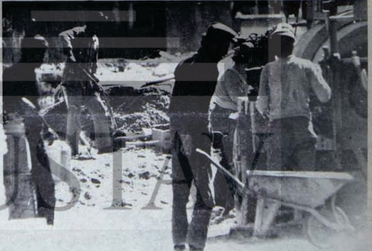
EMEKÇİ KİTLELERİN SA VUNULMASI BİR DENGE HESABI MI?

CHP, "sol'un sağ kanadı" olmak ile "sağ'ın sol kanadı" olmak arasında bir tercih yapmak ve çizgisini açık, tutarlı, kararlı bir biçimde ortaya koyup izle- mek durumundadır. Sürgeit ikisi arasında ikirciklik ve yalpalamalı kalmaz. Şimdiye kadar CHP, liderinin emekçi kitlelerin hak ve özgürlüklerini savunan ko- nuşmaları ile, "sol'un sağ kanadı" görünümünde ol- du. Parti pratiğinde ise, sürekli sol'dan ayrı ve uzak durma, hatta ona karşı olmak çabalarıyla "sağ'ın sol kanadı" olma tablosunu çizdi. Gençlik kollarının ra- poru karşısında Ecevit'in suskunluğu bur çerçeve içinde anlam kazanıyor. Demokratik, ilerici kamu- oyunun gözleri bugünlerde özellikle CHP ve Ecevit üzerindedir.