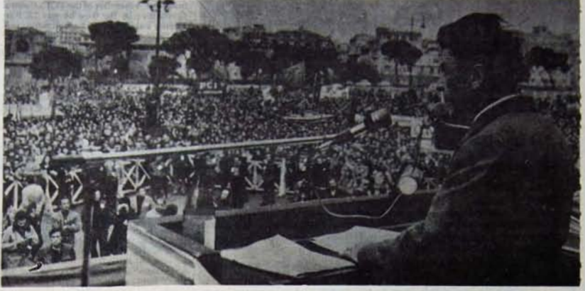
BERLINGUER, PARTİSİNİN ROMA'DA DÜZENLEDİĞİ BİR TOPLANTIYA KONUŞUYOR.

"Kuşkusuz bir bağ vardır. Fakat ben, bu yeni tavırların, Amerika'lıların çürümüş ve aciz hükümetleri destekleyerek fazla bir şey kazanamadıklarının artık anlamalarından ileri geldiği kanındayım. Yine anlaşılmalıdır ki, İtalyan halkının yenileme isteminin ifadesini bulmasına karşı çıkmaktan Amerikan halkının hiç bir kazancı yoktur. Atlantik Pakti ve NATO konusundaki tavrimiz ise biliniyor ve bunun seçimsel bir yanı yoktur. Bu tavr, seçim sorununun olmadığı sıralarda, son Kongremiz tarafından belirlendi. Bu tavrın iki temel nedeni var: Birincisi, İtalya'nın Atlantik blokundan tek tarafı olarak