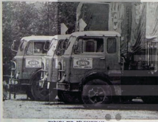
ESİNİN TIR FİLOSUNDAN...

12 Mart rejiminin kararlığında gazete patronluğuna doğru ilk adımlarını atan bir Babı-Âli erbabi, çıkardığı derginin ilk baş yazısında amacını şöyle tanımlamıştı: