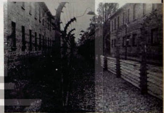
İnsanları birbirinden ayıran yüksek voltajlı tel örgüler