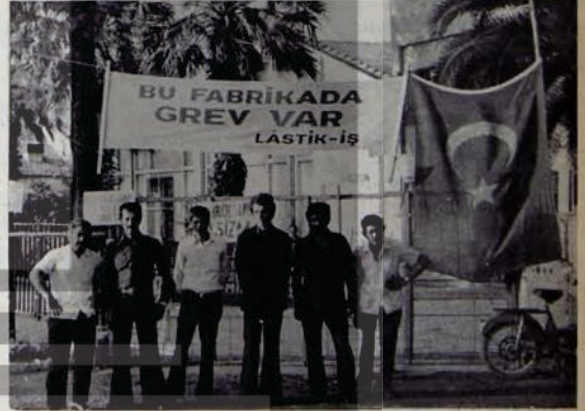
KENT LASTİK İŞÇİLERİ GREVDİ

5- İzmir Kemalpaşa yolu üzerinde kurulu OMSAŞ (Oluclu Mukavva Fabrikası)'da işçiler DISK Basın İş'e üye oldular. İşveren işçilerin sendikalaşma mücadelesini bastırarak için 10 işçinin iş aktını fesh etti. Arkadaşlarımızın işten çıkarılmasına karşı işçiler 10.4.1976 günü direniş geçtiler. İşveren yeni işçi olarak üretime başladığında acemi işçilerin makinanın motorunu yaktılar. İşveren yeni almış olduğu işçileri direniş-