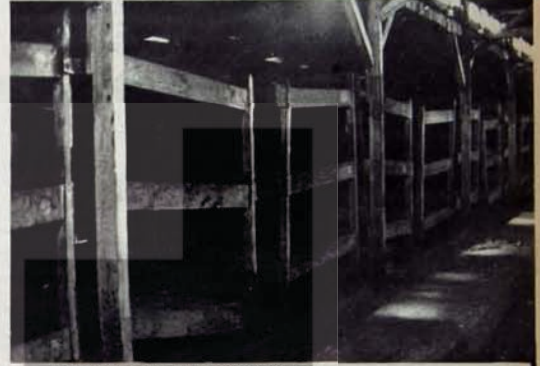
Bir kerestette 10 kişinin kaldığı barakalar

AŞAĞIDAKI GEZİ NOTLARI TÖM FAŞİST ÖRÖTLERE VE DESTEKÇİLERİNE İTHAF ÖLÖNÖR.