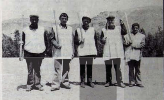
ÇELTEK'İN MADEN İŞÇİLERİ

ten önemli bir adım oldu. Bu çevremizdeki çeşitli örgütlerin meseleleri doğru kavramasından ve görev bilincinden ileri geliyor. Bu dayanışmayı, örgütler arasındaki bu dayanışmayı daha da güçlendirmek gerekiyor. Çünkü karşıımızdaki sermaye, örgütlü. Onun karşısına öfke dolu patlamalarla değil, örgütlü ve bilinçli adamlarla çıkmamız hep birliktedir.