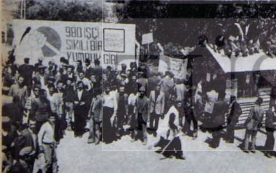
ÖRGÜTLÜ SERMAYEYE KARŞI ÖRGÜTLÜ MÜCADELE...