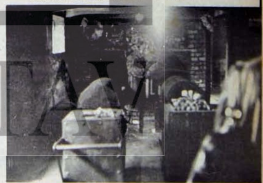
İnsanlar bu fırınlarda yakılıyor.