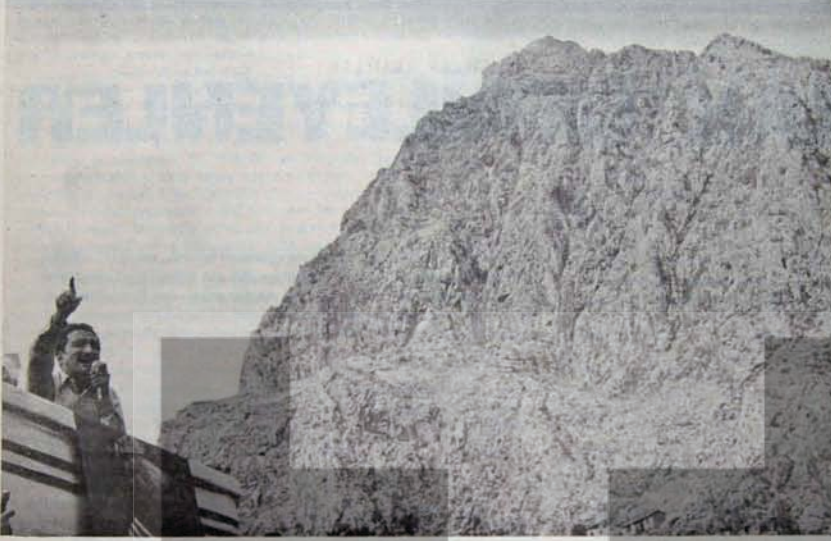
Ecevit: Soldaki gücün farkında

Geçtiğimiz haftanın Salı günü CHP ortak grubunda konuşan Bülent Ecevit, sennayenin beylik bir taktiğine değinirken şunları söylüyordu: