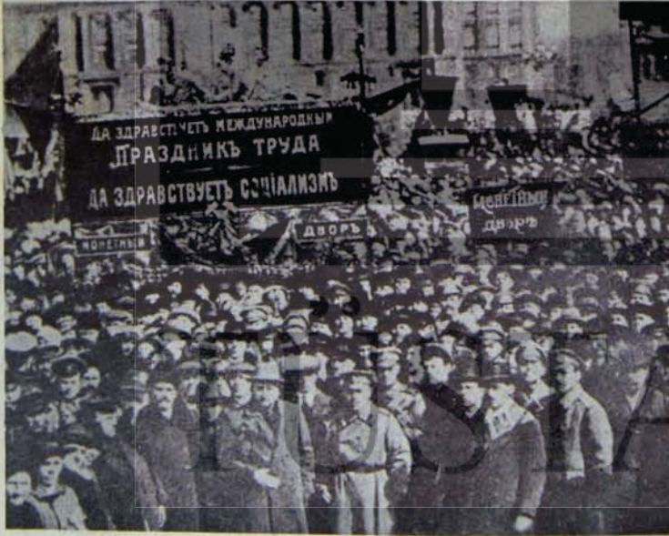
1917 Devriminin İlk 1 Mayıs

Evet, 1 Mayıs artık resmi bir bayramdı ve bu bayram devlet kutluyordu."