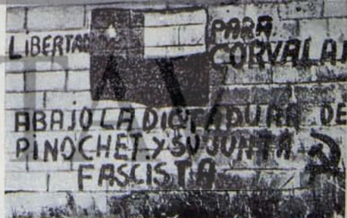
Sili Cuntası Lanetleniyor.

Proleter enternasyonalizm içeriğinin bu sürekli zenginleşme ve enternasyonalist politikanın faaliyet alanının genişleme süreci, 1969 yılı Uluslararası Komünistler Toplantısında öne sürülen şu slogonda tam ifadesini bulmuştur: "Sosyalist ülke halkları, kapitalist ülkelerin proleterleri ve tüm demokratik güçleri, özgürlüğe kavuşan ve ezilen halklar, empyalizme karşı, barış, ulusal bağımsızlık, toplumsal ilerleme, demokrasi ve sosyalizm için ortak mücadelede birlesin!"