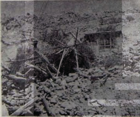
Tunceli'de Heyelan'ın Sonucu