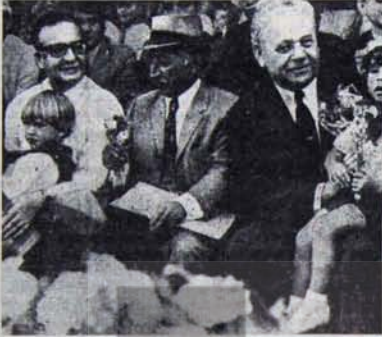
S. Allende, L. Corvalan ve A. Krilenco 1972'de Şili'de

Bu sloganın etkinliği, S.B.K.P. 25. Kongresinde de bir kez daha doğrulanmıştır. Bilindiği gibi dost komünist, devrimci-demokrat parti ve örgütlerin sayıları yüzün üstünde olan heyetleri kongreye katıldı. (Bu, son yılların en yüksek rakamıydı.) Bu heyetlerin varlığı, kongre kürsüsünden yaptıkları konuşmalar ve öne sürdüğü fikirler Partimizi, barış ve halkların özgürlüğü, toplumsal ilerleme ve sosyalizm için mücadele veren dünya çapındaki cephenin tüm safalarına sayılmaz bir biçimde bağlayan hayati enternasyonalizm bağlarının daha da genişlediğini ve güçlendiğini kanıtlıyor.