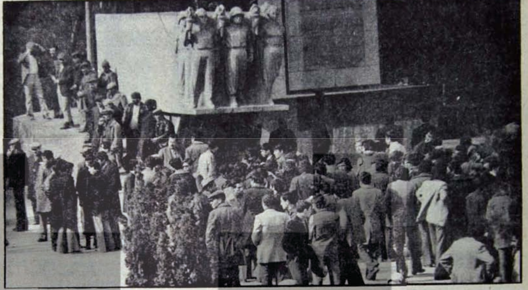
Faşistler Vilayet önünde toplu halde

8 Mart Pazartesi günü Kimya Mühendisliği, Mimarlık ve Eczacılık okulları da faşistler tarafından işgal edilmiştir. Gerçekte güçleri az olan faşistler işgalin genişletilmesi münasebeti ile diğer okullardan ve şehirlerden gelen tak-