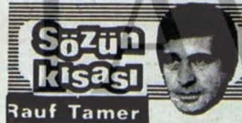
Akil hocluğu mu yapıyor?

ler, öğrenci müfettişi ile konuşup onu da "etkilemişlerdi". Olayın anlatıldığı polislerin "bu kendi aranızdaki bir mesele, biz karışmayız" demesi, öğrenci