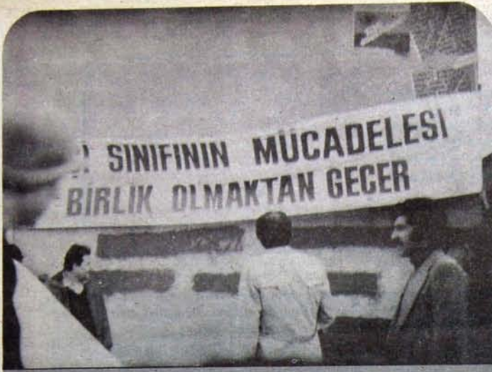
Evma işçileri direniyor