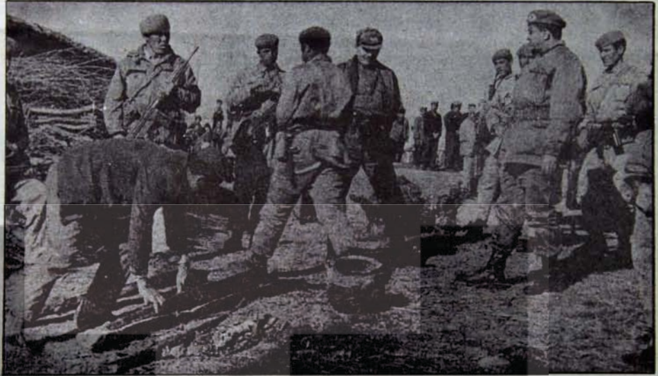
Doğu halkının çilesi sosyalizmle son bulacak