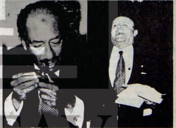
"YILIN ADAMLARI" MI, ABD'NİN ADAMLARI MI