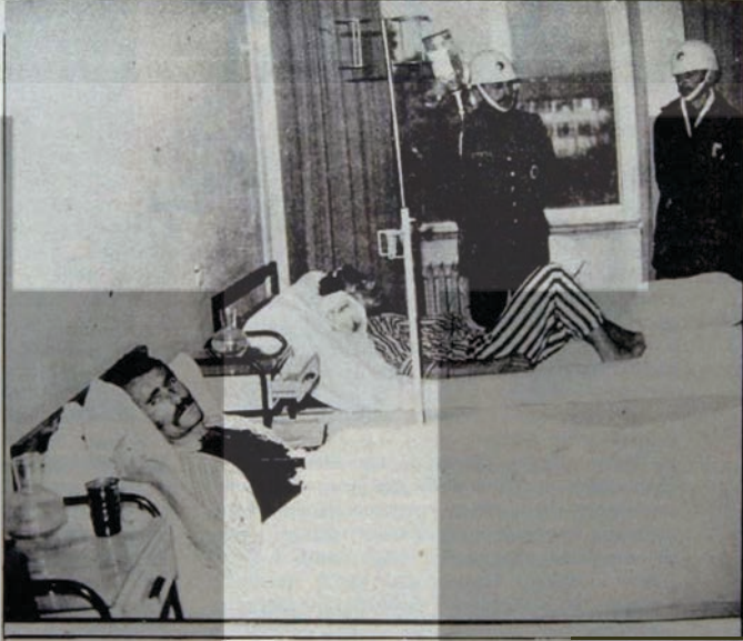
Yaralı işçiler hastahane de seldirya uğradılar

Koltuk değneği ile yürüyen Maraş'lı işçi aynen böyle anlatıyor olayı. Saldırı