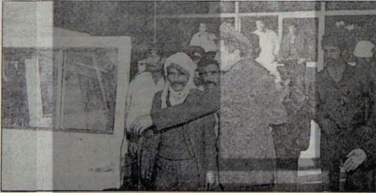
Komandoların boy hedefi

fabrikanın diğer bölümlerine de sistemli ve planlı bir biçimde yöneltiliyor. Burarlarda olanları bir başka işçinin ağzından dinleyelim: