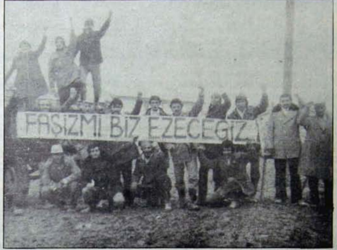
Cihanbeyli işçilerinin yumruğu

İşçiler toplu halde Petrol - İş'ten istifa ederek devrimci Petrol - Kimya İş'e geçtiler. Sendikasını değiştirmeyen bir tek işçi yoktur. Petrol - Kimya İş yetkili olduğunu ilan edince, "Alkim"