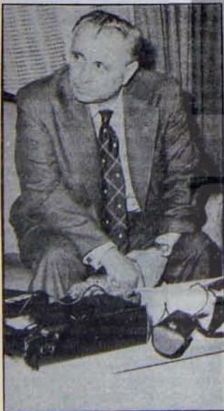
Eyüboğlu : Anti demokratik yasaları görece, sonra karar verecek

Bütün bu yoğun faaliyetler sürdürülürken, Genel Başkanı "Beyaz Zambaklar Ülkesi"nde dolaşan CHP ne yapıyordu?..