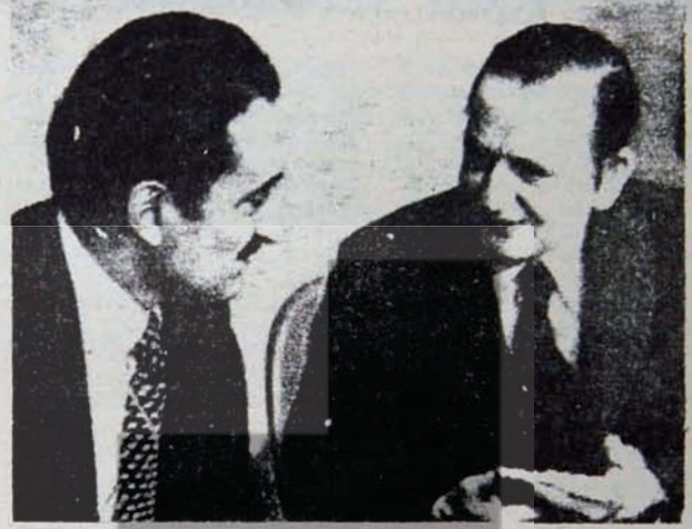
Ecevit Olaf Palme ile

Türkiye'deki ilerici partilerin, demokratik kuruluşların, dış ülkelerde i-