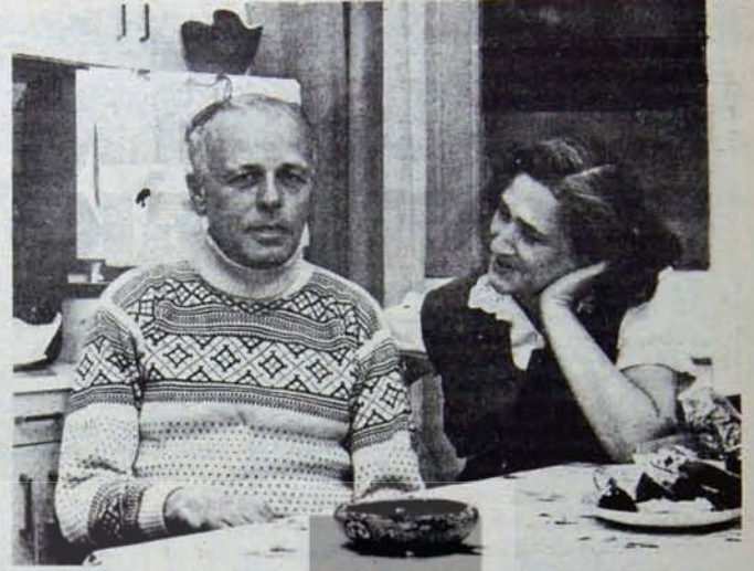
Parayı veren düdüğü çalarmış...

Batılı yorumcular, ağız birliği ederek Saharov'un