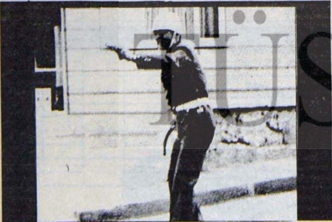
BİLEREK VE DİKKATLE