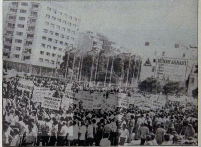
DİSK İZMİR MİTİNGİ: