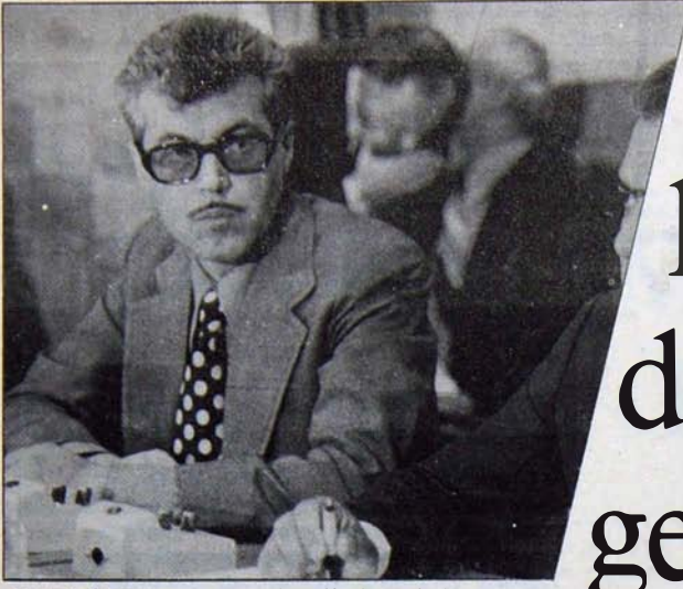
Mustafa Erkovan Komandolar Nerde Çöplüyor?