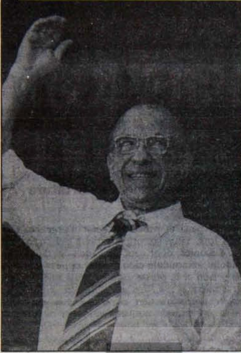
IKP Genel Sekreteri Santiago Carillo