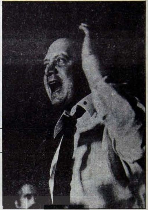
Karşı Devrimin Bayrağı Soares

Devrimin kararlı adımları ile artık kesinlikle belli olmuştur ki Portekiz'de faşizmin yerini, tekellerin egemen olacağı bir burjuva demokrasisi değil, emekçilerin, iktidarı bizzat kullanacağı bir halk demokrasisi alacaktı. Sermayenin iç savunucuları ile onların dış koruyucuları buna göz yumamazlardı. 25 Nisan'ın getirdiği demokratik ve ilerici dinamik içinde açıkça sağ adına ortaya çıkmak mümkün olmadığı için de daha "akıllı" bir çıkış yolu bulunmak gerekiyordu. İşte Mario Soares'in işlevi burada belli oldu. Sosyalizm adına ortaya çıkan Soares, Vasco Gonçalves'e ve devrimin en kararlı savunucusu Portekiz Komünist Partisi'ne karşı amansız bir saldırıya geçti; uzlaşmaz bir tavır takındı. En ilkel bir anti-komünizmin beylik teraneleriyi ülkenin en gerici güçlerini etrafına topladı.