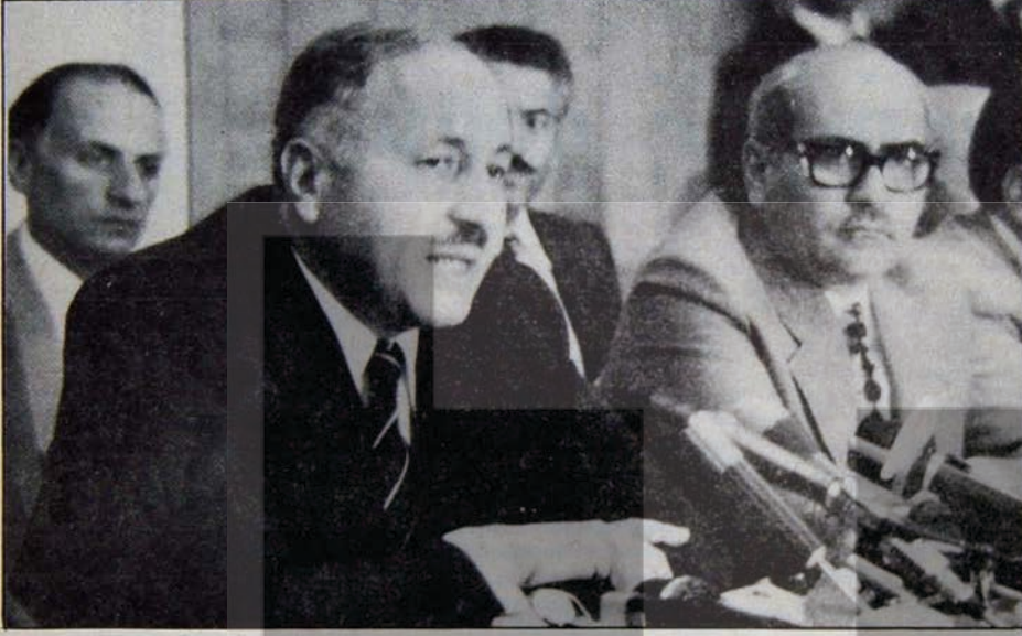
Tekelcilerle Bağlar Sarılıyor

Geçtiğimiz haftanın Cuma günü, Iğdır ilçesinden TÖB - DER şubesine bağlı öğretmenler, ortaklaşa imzayla Cumhurbaşkanı Fahri Korutürk ve Genelkurmay Başkanı Orgeneral Semih Sancar'a birer telgraf çekerek, bir konu hakkında görüşlerini sordular.