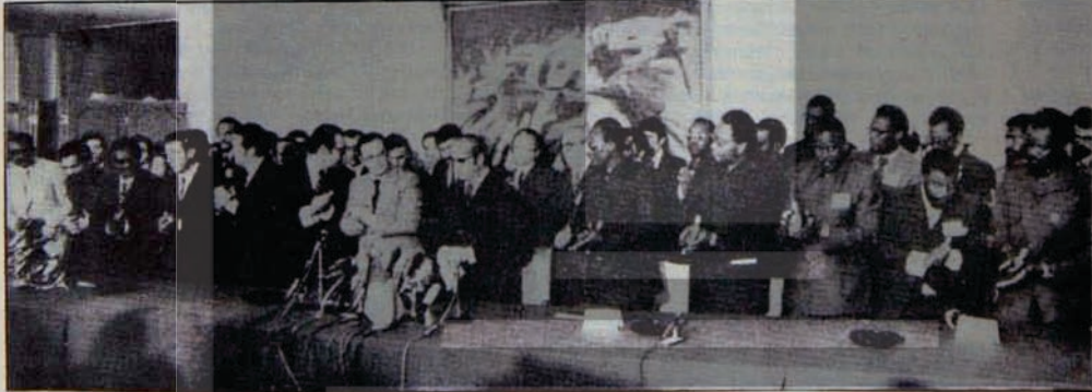
ALVOR ANLAŞMASI İMZALANIYOR

Önümüzdeki 11 Kasım'da bağımsızlığını kazanacak olan, 6 milyon nüfuslu Angola'da kanlı tertipler sahneye konuluyor. 500 yıldır sömürge olarak yaşayan bu halkın bağımsızlığına göz diken emperyalizm ile yerli gerici güçler yanında, Portekiz'de çıkarları yok edilen egemen güçler de bu tertiplerin içinde yer alıyor.