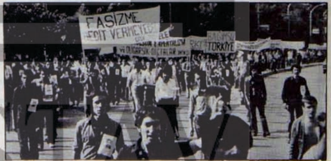
BURSA'DAKİ İLK ANTI-FAŞİST YÜRÜYÜŞ

Bu büyük protesto hareketinden ürken polis, tertip komitesine karşı bir baskı hareketine girişti. Tertip komitesi üyelerini aramaya, onları