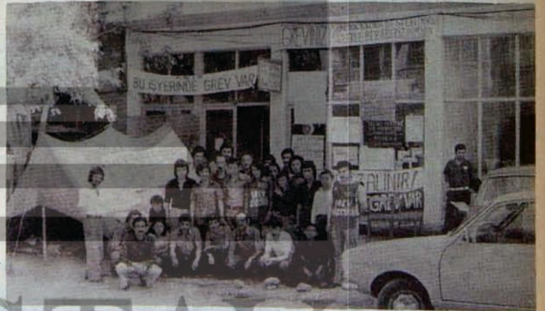
GREVDEKİ ULUSOY İŞÇİLERİ İLE DAYANIŞMA

Tek tek uyumsuzluklar, grevler bütüne doğru ilerliyor. İşçi sınıfı ile patronlar sınıfı arasındaki uzlaşmaz çelişki her geçen gün belirginleşiyor. Her geçen gün işçi sınıfından yeni yeni elemanlar karşılarındaki gücü tanıyorlar, bilinçleniyorlar. İşçi sınıfının mücadelesi bütünleşiyor. İşçi sınıfı iktidarına giden yolda yeni yeni engeller açılıyor.