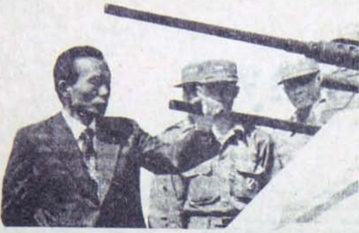
Park Chung Lee Ateşle Oynuyor.

nın durumunu aydınlatmaktadır! "Kore yarımadasında barışı (!) ve güvenliği korumaya kararlıyız, çünküburası Japonya ve tüm Asya için hayati önem taşımaktadır."