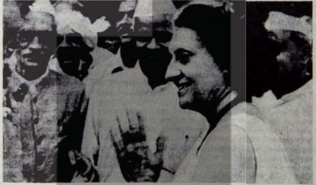
İNDİRA GANDİ: TEKELLERİN VE BÜYÜK TOPRAK SAHİPLERİNİN BOY HEDEFİ

Bunakarşılık, Kongre'nin dörtte üçü ve Hindistan Komünist Partisi, birleşen sağa karşı Gandi'yi desteklemektedir. Kongre ve Hindistan Komünist Partisi, "kitleleri, gericiğin kirli amaçların hüsrana uğratmaya" çağırılmışlardır.