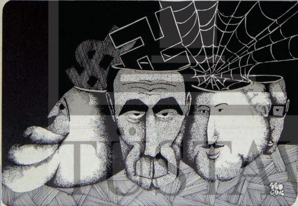
• CEPHE-i MİLLİ •

Bağta Sovyetler Birliği olmak üzere bütün sosyalist ülkelerin verdikleri krediler, işte bu önemli yönleri ile emperyalizmin sözde kredilerinden ayrılıyor. İlericiler ve sosyalistler, Türkiye işçi sınıfının gelişmesine katkıda bulunan ve Türkiye'nin emperyalizme olan bağımlılığını azaltmaya yönelik bu tür kredilere karşı değildirlir.