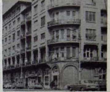
VAKIFLAR GENEL MÜDÜRLÜĞÜ