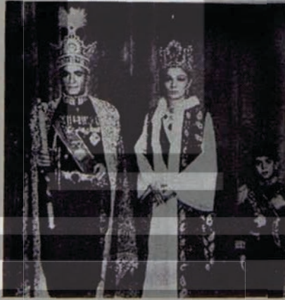
İRAN'A BAĞLANAN YOLLAR...

Bir de "uzun dönemli projeler üzerinde fizibilite çalışmalarına başlanması" sorunu var. Bu, kısa dönemli işlerin pek de büyük çapta alamayacağına daha kibar deyimlerle ifadesi.