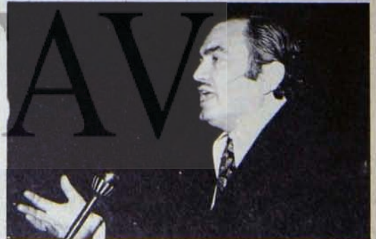
DİSK GENEL BAŞKANI KEMAL TÜRKLER

no, işçilerin baskı altında tutul - masına rağmen DİSK'i sindirme ve dağıtma çabaları sonuçsuz, keldi. San bir yıldı peş peşe bağımsız sendikalar DİSK'e ka - tılıyor. DİSK kuruluşunun 8. yıl - lını daldururken anurlu ve güç - lü mücadelesi büyüyor ve geli - şiyor.