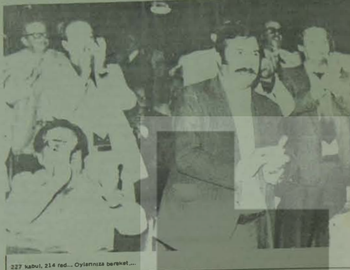
227 kabul, 214 red... Oylarınıza bereket...

kanlık talep etmedim" şakasını yaparken, yanındaki kurmaylarına "Aytekin bey bir haber getirdi mi acaba" diye soruyordu. Aytekin Beyden beklediği "Ecevit'in Erbakan'ın başbakanlığı önerisine razı olup olmadığını" ilişkin yanıt" geçtikten MSP lideri burçunlaşarak "biz kararlığa kurşun atmaz" diyor-du.