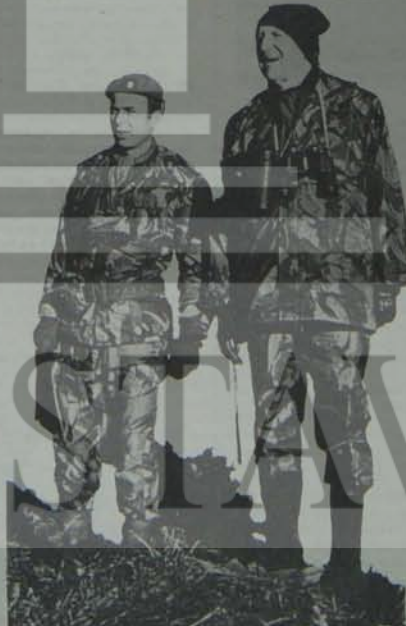
Aslan avcı kurnaz

NATO Konseyinin 25 Haziran 1980'de Ankara'da başlayan toplantısı yukarıda aktarmaya çalıştığımız bağlam ve düşünceler içinde yorumlanmalıdır. Özellikle büyük dikkate alınmalıdır. Söz konusu olan ülkemizin, bölgenin, giderek tüm dünya- nın barış ve güvenliğidir. Ne var ki, tüm olumsuz gelişmelere karşı barış ve detant konusunda umutsuzluğa düşmek de la- zımdır. Çünkü dünya barış güçle- ri, bugün, dünya orantılı detanti daha da etkin biçimde koru- yacak güçtedir. Sovyet lideri Leonid Brejnev'in dediği gibi "emperyalizmin bu saldırganlığı, dünya egemenliğini amaçla- yan macera politikasını, sadece barışa bağlı devletlerin gerçekçi politikası ve halkların kararlılığı engellenecektir."