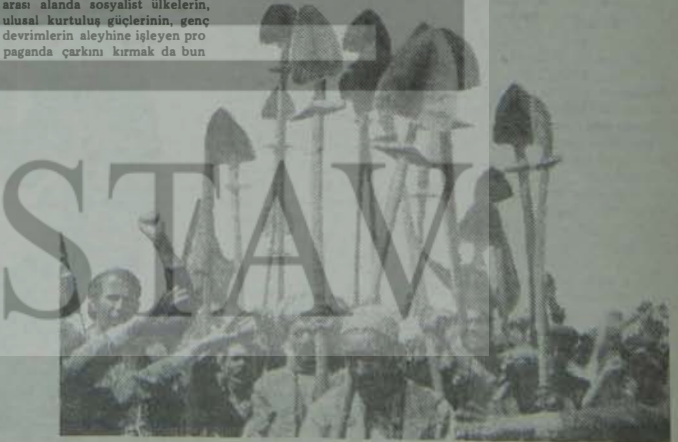
Emperyalizm, yalanların pis kokusunda boğulurken Afgan devrimi olgunlaşıyor.

Ancak, dikkat çekici olan artık "direniş güçlerinden" hiç söz edilmemesi. Pakistan dağlarında ellerinde tüfeğe para karşılığı resin çekiren çapulcuların emperyalizm umudunu kesmiş görünüyor. Afganistan üzerinde görünmeme istenen oyun, sosyalizm tarafından bir kez daha bozuldu ve Afgan devrimi kendisi yalancı geleceğe güven içendi ilerliyor.