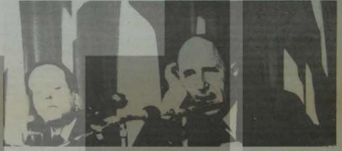
anlat "sayın" Luns anlat...

NATO Bakanlar Konseyi ve ardından gelen olaylar belki de Türkiye'li politikacıların bilincaltlarına garip bir korkunun yerleşmesine neden olmuştur. Bu yüzden yirmi yıl ya yakın bir dönemdir hiçbir Türkiye Hükümeti NATO Bakanlar Konseyi toplantısının Türkiye'de yapılması konusunda talepte bulunmamıştır.