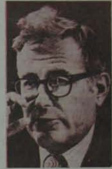
HAROLD BROWN: "Belli ve uygun koşullarda Sovyet toprakındaki hedeflere stratejik si- lahlarla darbe indirme" amaçlı açıklayan ABD Savunma Bakanı...