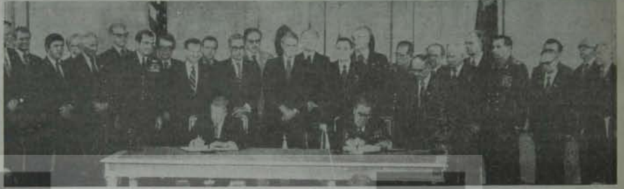
SALT II: ABD'nin zoraki imzası...