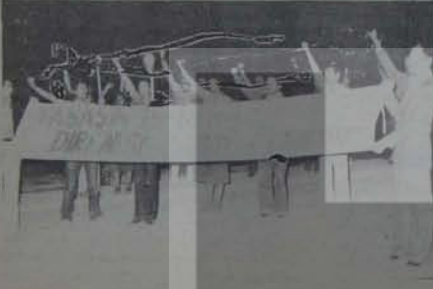
▲ 15-16 Haziran işçi direnişinin 10. yıldönümünde Ankara'da çeşitli eylemler düzenlendi. Fotoğrafta, Genç Öncülerin ve ilericilerin Ankara, Maltepe'de yaptıkları gösteri görülmüştür.

Antifaşist gençlik, Genç Öncüler, ve sağlanan eylem birlikleri yazgın gösterilerle, 10. yıldönümünde de 15-16 Haziran'ın devrimci ruhunu yaşattılar, yaşatacaklarını gösterdiler.