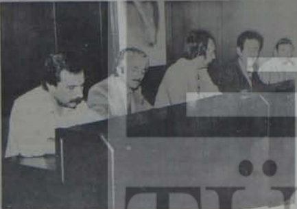
İşçisınıfının sendikal eylem birliğinde bir adım...

İSTANBUL - Cam ve şişe işkolunda, toplu sözleşme öncesi tekelere karşı gerçekleştirilen eylem birliği gelişiyor.