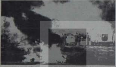
Emperyalizm Kara Afrika'nın özgürlük ateşini söndüremeyecektir

Şimdi anaranın en güneyinde, Güney Afrika'da aynı savaşımın kıvılcımları parlamaktadır. Bundan 4 yıl önce küçük bir kasabada, Soweto'da atılan tohumlar yeşermekte ve sağlıklı biçimde, geleceğe güvenle bakarak büyümektedirler.