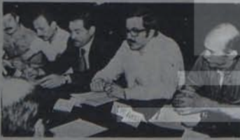
▲ TRT yayınları ve yönetimi artık başbos değil! Demokrasi ölümleri TRT'yi denetliyor...

"TRT üzerinde, kitlelerin denetimini sağlamak için demokratik kitle örgütleri bir 'yayın değerlendirme kurulu' oluşturuldu.