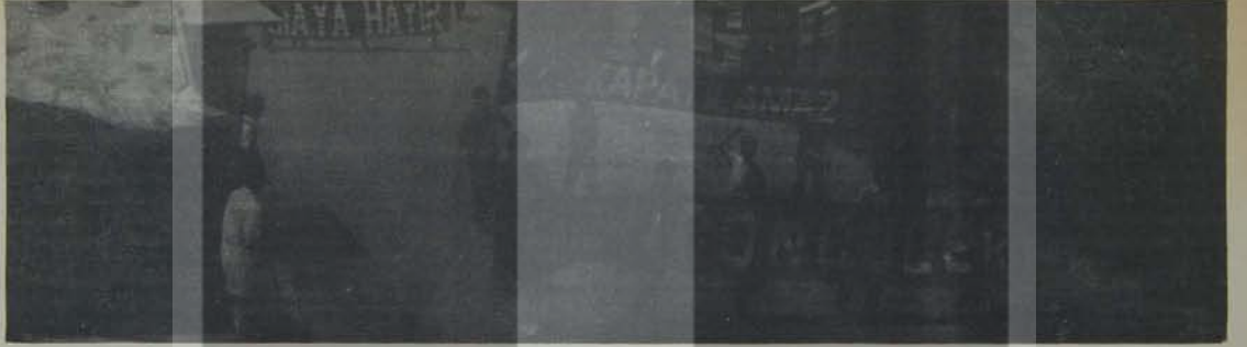
Gençler SIA'ya hayır diyor...

Ankara'da Genç Öncülerin, İlerici Gençlerin, Sosyalist Gençlerin ortak olarak düzenledikleri "SIA'ya Hayır" gösterisi Maltepe'de gerçekleştirildi. Asılan pankartlar, yapılan konuşma, dağıtılan pullar ve sloganlarla coşkulu biçime dönüşen gösteri, semtin kalabalık olduğu bir saatte gerçekleştirildi. Kitlelerin de katıldığı gösteri, aynı zamanda faşistlerin ele geçirmek için siirekl saldırdıkları bir bölgede gerçekleştirilmesiyle de önem kazandı.