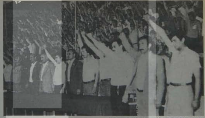
Narın tekstil patronlarına işçi sınıfının demir yumruğu

5 yıl süreyle askıya alınan, sendikaların temel işlevini yok eden Eşel-Mobil adlı yasa tasarısı gündeme getirilmiştir. Toplu Sözleşme Koordinasyon Kurulu da aynı amaçla tahkim sistemi yeniden egemen kulmanın aracı yapılmak istenmektedir. Bu önlemler diğer temel hak ve özgürlükleri büyük ölçüde kısıtlıyıcı yasa ve yasa değişiklikleri ile