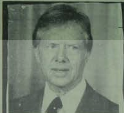
Ormanlık: eski Sovyet tehdidi, abartılmakla, İtalyanlar Amerika Başkanı Carter

Türkiye'de büyük basın ise tam bir mirmekkep balığı görünümünde. Kağıt fiyatlarına zammi en büyük trajedi gazetesinin temeldi bizzat önermiştir Sanayi ve Teknoloji Bakanının ödasesinde öngörülmekte. Kültürel kağıdın atası pahası olduğu Türkiye'de kağıtlar ve mirmek-