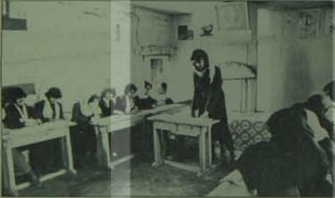
Devrimci Afganistan'ın gönüllü öğretmenleri, gönüllü emekçileri