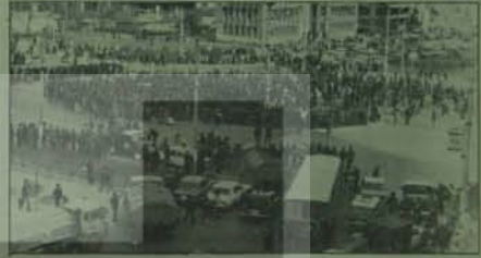
16 Mart katliamına demokrasi güçleri 20 Mart'ta yanıt verdi