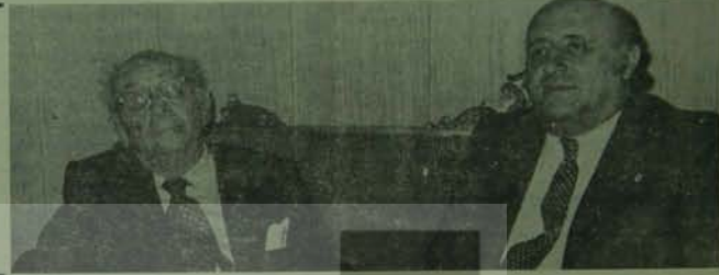
demeçle olayı kınadı ve şöyle dedi:

Tüm demokratik hak ve özgürlükleri hedef alan bu uygulamaya üzerine Türkiye İşçi Partisi Genel Başkanı Behice Boran bir