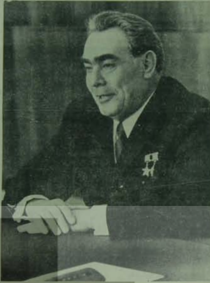
Sovyetler Birliği Devlet Başkanı ve SBKP MK Genel Sekreteri Leonid İlyiç Brejnev, emperyalizmin Afganistan ve İran'daki gelişmeleri bahane ederek barış, silahsızlanma ve yumuşama doğrultusunu sapıtma girişimlerine ilişkin olarak Pravda Gazetesine bir açıklama yaptı. Sovyetler Birliği'nin Afganistan Demokratik Cumhuriyeti'ne yaptığı yardım hakkında Sovyet hükümetinin görüşlerini bir kez daha açıklayan Brejnev'in bu açıklamasını özetleyerek yayınlıyoruz.

Şiz saldırıya karşı savaş veren Afgan yönetimi daha baştan Tarekî devrinde ve sonra da defalarca yardım için Sovyetler Birliği'ne başvurmuştu. Biz de kendi tarafımızdan saldırı durdurulmazsa Afgan halkını felakete başbaşa bırakmıyacağımız hususunda kim gerekliyorduydu uyardık. Bilindiği gibi biz sözcümüzün eriyiz. İktidarı ele geçirecek Afgan toplumunun geniş çevrelerini keşif, parti ve ordu kadrolarına, aydın temsilcilerine, İslam din adamlarına, yani asıl Nisan devriminin dayanması olduğu çevrelere karşı acımasız bir tedbir başlatılan Amin, Afganistan'a karşı saldırıların emeliyle yarımcı oldu. Ve Babrak Karmal'in başında bulunduğu Demokratik Halk Partisi'nin yönetimi altında Afgan Halkı Amin'in bu zulmine karşı ayaklandı. Bugün