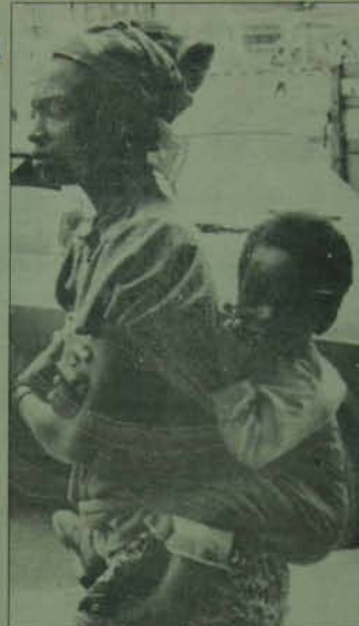
1979'da kurtuluşunun 3. yılını kutlayan Angola ezilen halklara örneklik ediyor.

Emperyalizm silahlanma yarışında yeni adımlar atarak, "Sovyet tehdidi" masasını hâlâ diri tutarak, yeni bir soğuk savaşta sürüklenmek istiyor dünyamızı. Geçtiğimiz yılın hemen başında Pekin yönetiminin Vietnam'a karşı başlattığı alcağak saldırı, emperyalizmin zenginliği dünya çapında tımanırma politikasını