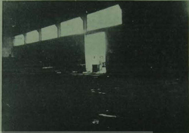
Enerji bunalımın faturasını emekçiler ödüyor

Peki, çaresiz miyiz? Bunun kurtuluşu yok mudur? Kısa dönemde durumun daha da kötüleşmesini beklemek gerekiyor.