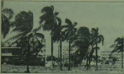
Küba, devrimin 21. yılını kutluyor