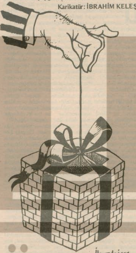
Karikatür: İBRAHİM KELEŞ

iv. Terörün toplumun her kesimini etkilemesini sağlamak için, her kesimden uygun hedefler bulmak ve suikastler düzenlemek. Toplumsal panik ortamını yaygınlaştırmak.