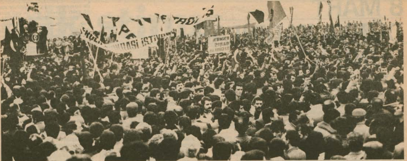
Sırtını Yılmaz'a dönerek slogan atan, protesto eden kitleler