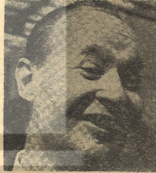
Güler yüzü «Liberal bir Sosyalizm», in!

«Sosyalizmde reform», «İnsancıl sosyalizm», gibi sloganlarla ortaya çıkarak Çekoslovakya'da Marksist-Leninist teoriden sapmanın ötesinde bir karşı-devrim hazırlama çabası.