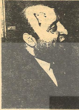
Başta Demirel'e sorun soruları.

Sonra geniş halk yığınlarımızın kendi eliyle seçtiği milletvekili ile seçimler dışında karşı karşıya gelme olanakları da pek yoktur.