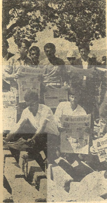
İŞÇİ-KÖYLÜ Yarımca işçilerin de mücadele silâhidir.

— Bu hareketi kalben destekliyorum ve sonuna kadar destekleyeceğim.