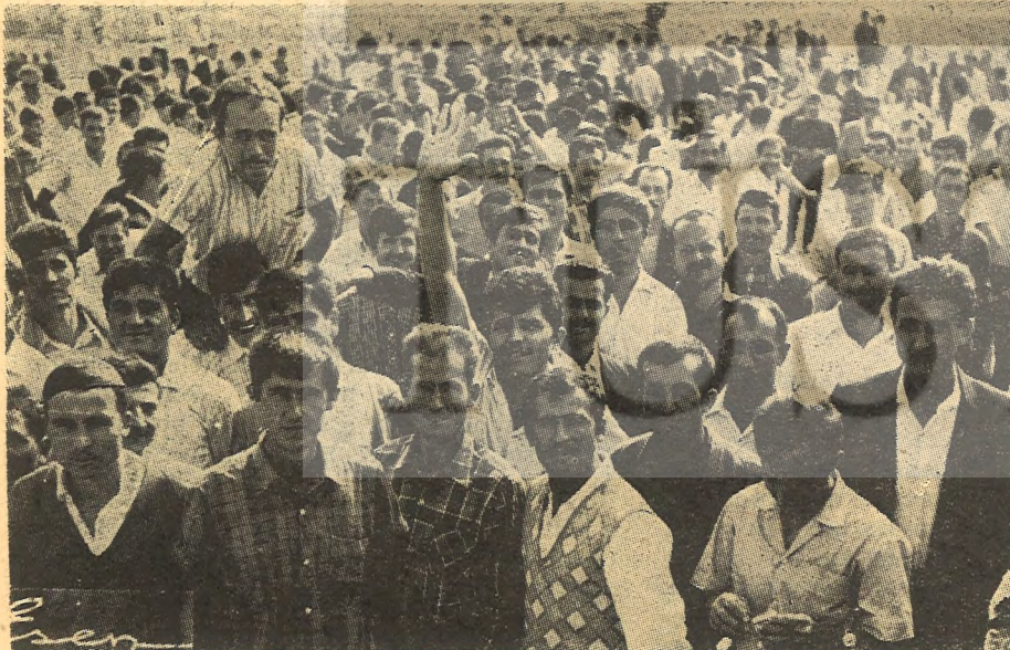
Yarımca işçi mitingi