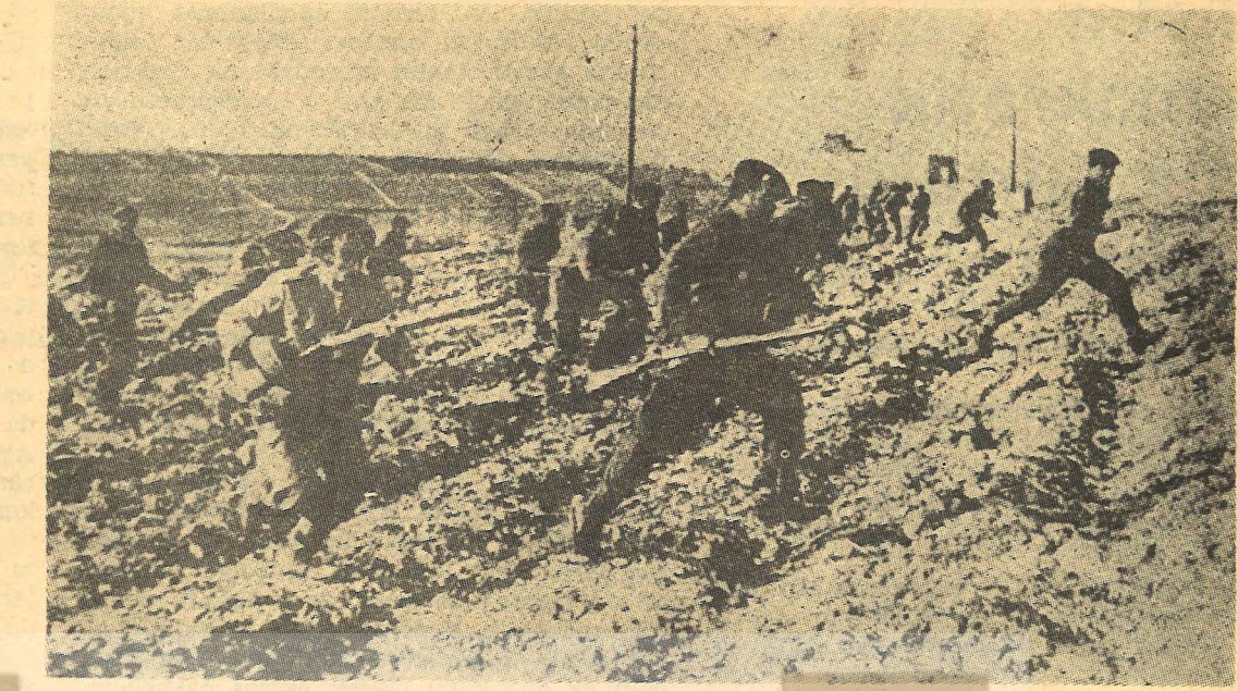
Filistin Demokratik Halk Kurtuluş Cephesi savaşçıları bir harekatta.

yok. Günlük yemeklerini Birleşmiş Milletler teşkilâtı verir. Barakaların arasından ikişer sıra marşlar söyliyerek geçtik. Bu barakalarda ne yazın sıcakta, ne de kışın soğukta barınmak imkânsız gibi birşey. Sokaklarda yığınla çocuklar yarı çıplak, yırtık pırtık çaputlar içinde. Mülteci kampının ortasındaki meydana geldik. Bir grup fedai, Demokratik Cephe'nin mültecilerle ilgilenen bürosuna gidip kazma ve kürekleri getirdi. Burada yarım kalan sığınagın inşaatı için temel kazmaya devam edildi. Demokratik Cephe, mültecilerin İsrail uçak taaruzlarında sığınabileceği sığınaklar yapmaya var güçleriyle devam ediyor. Fedailerin bu çalışmasına mülteciler de katılarak, fedailerle halk birbirine daha sıkı bağlanıp kavga çizgilerini birleştiriyorlar.