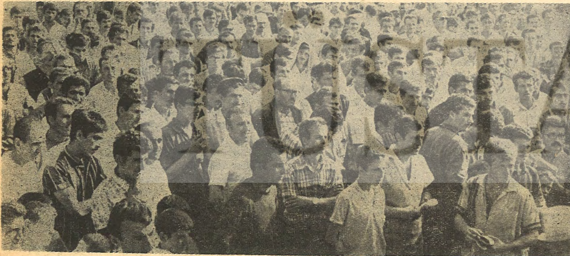
Yaşasın işçiler, yaşasın gençler! Türkiye bizimdir!

Şimdiye kadar konuşma yapan arkadaşlar işçi kardeşlerimizin şikayetlerini dile getirdiler. Bunlar bize bir gerçeği daha gösterdi. O da