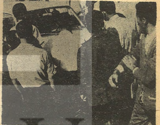
Müdür fabrikaya sokulmuyor.

yapıyorum. Bu memlekette kanunları siz uygulamıyorsunuz. Türkiye'de bağımsız hakimler vardır.»