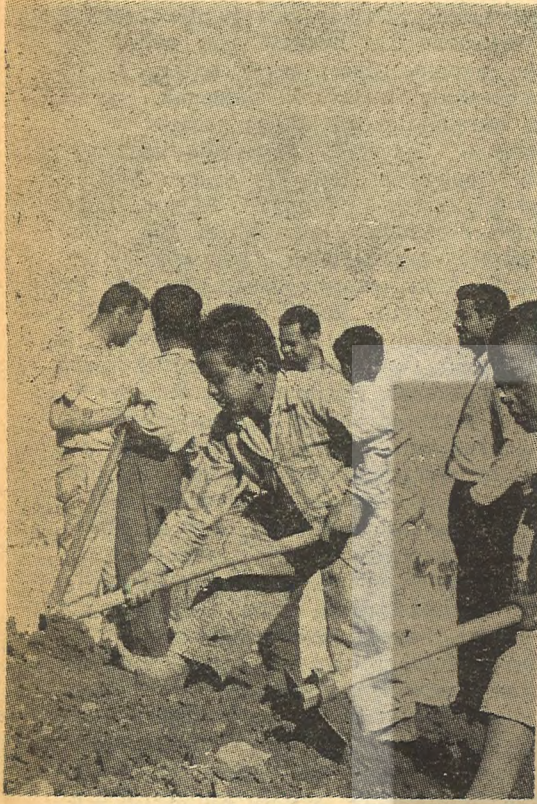
Küçükler de çalışır ve savaşa hazırlanırlar.

(Filistin Demokratik Halk Kurtuluş Cephesi röportajı genç bir Arap öğrenci tarafından hazırlanmıştır.)