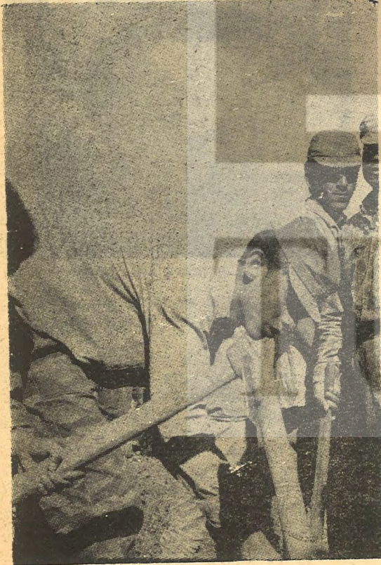
Gençler çalışır ve savaşır.

Amman'daki ofisten akşam üzeri bir landrovere atladık. Amman'a 20 kilometre uzakta bir dağ yoluna saptık. 3.5 kilometre sonra arabamız bir dere girişinde durakladı. Devriyeler bize baktı. Fedai arkadaşım la birşeyler konuştular. Sonra devam ettik. Biraz ileride, derenin yamaçlarında 6-7 tane