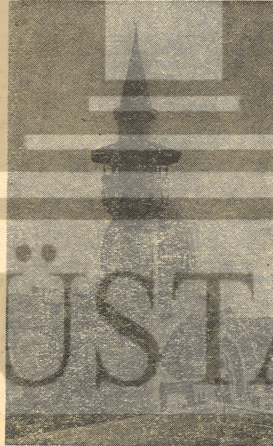
Romanya'da Köstence Cumhuriyet Camii. Bu camii Romanya Hükümetinin 1 milyon lira yardımıyla geçenlerde onarıldı.

Meridiane Yayınevi Avrupa'da belki en ucuz kitap basan yer. Batı'dan siparişler alıyor, kitapları o Batı dilinde basıp «Cartimex» dedikleri bir