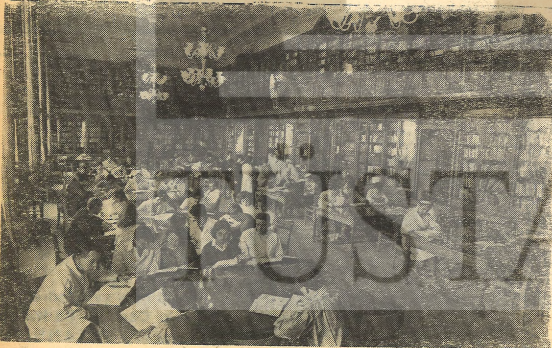
Bükreş Üniversitesi Tıp Fakültesinde bir okuma odası. Romanya'da 700 kişiye bir doktor düşüyor.

Romen bilim çevreleri hakkındaki sözlerimi yer darlığından ötürü burada kesmek ve başka konulara, az da olsa, yer vermek zorundayım. Yalnız, bilim çevrelerinin çok ciddi çalışmalar içinde olduklarını, Türk bilim çevreleriyle daha yakın teması içtenlikle ve kuşkusuz hiç bir ard niyet beslemeden istediklerini, özellikle Romen tarih'nin bir kaç yüzyılının yatmakta olduğu eski yazı Türk arşivlerini bir ekip halinde elden geçirmeyi arzuladıklarını ve bilimsel düzeydeki temaslar ve üniversite öğretim üyesi değiş tokuşundan bizim de faydalar sağlayacağımızı tekrar etmek isterim.