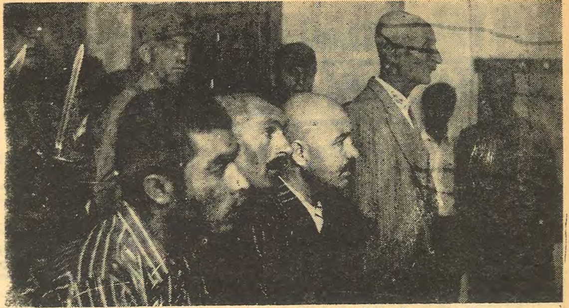
— Yargılanan devrimci köy liderleri mahkemede —

yirmi kere okuyormuş. «Napak?» diyordu. «Kı-sın yapacak fazla bir iş yok. Okuyorum...»