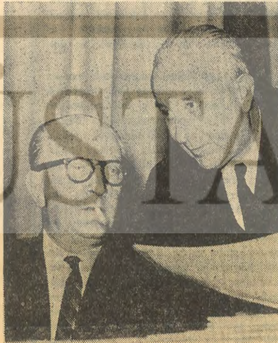
GUY MOLLET ve GASTON DEFERRE

«Mollet arkadaş»ın partisi henüz bu teklife bir cevap vermedi. Yalnız aynı gün yayın-