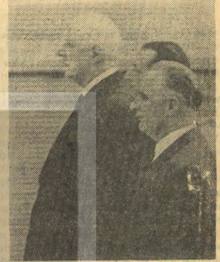
DE GAULLE ve POMPİDOU

ratik düzenini sürdürmesi hergün bugünkü şartlarda, Fransa'da, bir kapitalist iktidarın, burjuva demoklukların daha da artacağını görebek güven oyuna gitmiştir. Hergün daha fazla güçlükler yaratmaktadır.