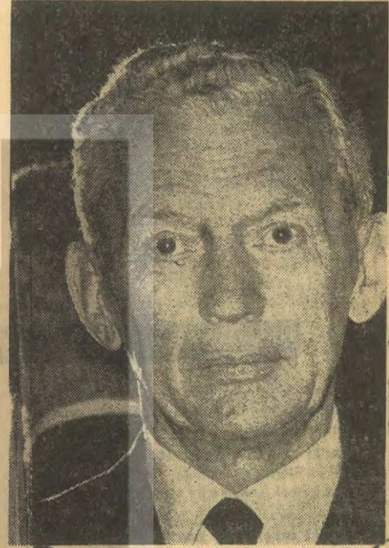
MAURICE COUVE DE MURVILLE

ladıkları bir bildiri «Cumhurbaşkanı seçiminde 1958'deki duruma dönülmesini, yani başkanlığın temsili bir makam olmasını, bir politik programa dayanan yönetici bir şef durumunda olmamasını» savunmaları, hangi havalardan çıktıklarını gösteriyor. Bugüne kadar Fransadaki sol hareketin tek cepheye toplanmasının baş sorumlularından olan Mollet'nin, tam da politika sahnesinde rahatça at oynatma fırsatı çıktığı zaman, bilinen tutumunu değiştirip programlı, düzenli bir güçbirliğine yanaşması yakın bir ihtimal değil. Marsilya belediye reisi sosyalist Gaston Defferre'de bütün sol kanatça desteklenmeyeceğini bile bile adaylığını koydu. Önemündeki günler, bütün bunlara rağmen, sol kanattaki kargaşalığın giderilip giderilemeyeceğini gösterecek.