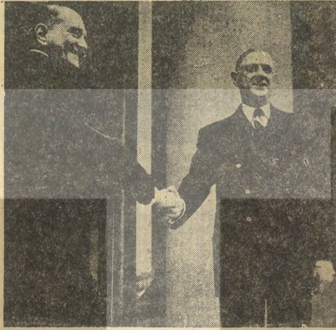
— 1958'de muzaffer bir edayla Elysée sarayına girerken —

Halk oyuna sunulan tasarı, yasal, ekonomik ve mali yönlerden kısmi bağımsızlığa sahip 21 bölge kurulmasını öngörüyordu. Bu bölgelerin yasama meclisleri, devlet kredilerinin onda birini, kendi kararlaştıracakları işlere yatırılabileceklerdi. Ayrıca devlet yatırımları da 3 grupta toplanıyordu. (A) grubu yatırımları (şehirlerarası yollar, telekomünikasyon tesisleri, bilimsel araştırmalar) gerçekleştirme işini devlet üstüne alıyor (B) ve (C) gruplarını ise bölgelere devrediyordu. Bu arada, yeni kurulacak bölgesel sisteme uydurmak gerekçesi ile senatonun yasa-yetkisi kaldırılıyor ve tek meclis sistemine dönülüyordu. Tasarı yeni sistemle ilgili mali, ekonomik ve yasal detayları içeriyordu ve aslında uzmanlardan kurulu komisyonlarda tartışılması, meclislerden geçmesi gereken bir kanunun «halk oyu»na sunulmasının «garabeti» ortadaydı. Hal böyleyken, referandumun bir «güven oyu» haline getirilmesini yadırgayan, bunu da Gaulle'ün inatçılığına bağlayan yorumlara şaşmamak elde değil... Oysa «güven oyu» istenmesi, bu kadar teknik ve karışık sorunların halk oyuna sunulmasını açıklayan tek nedendir. De Gaulle yönetimi ve genellikle Fransız kapitalizmi büyük güçlüklerle karşı karşıyadır. Amerikan emperyalizmi bir yandan Fransız şirketlerinin hisse senetlerini ele geçirerek, bir yandan İngilizlerin ortak pazara girme taleplerini destekliyerek Fransayı sıkıştırmaktadır. 1968 Mayıs