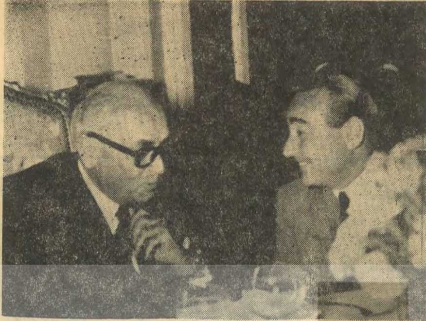
BAYAR VE MENDERES

Bu iki kafadar, Amerikan emperyalizminin sadık dostları çıkmıştı. Türkiye'nin büyük bir hızla Amerikan vesayesine girmesinde başrolü oynadılar.