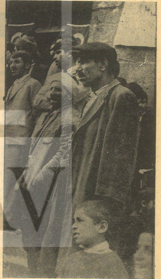
Doğu halkı mitingini izliyor

İşte bu nedenlerle başta sosyalistler olmak üzere, bütün millici ve demokrat güçler Kürt Halkının sorunlarına sahip çıkmalı ve Dünya Halklarının Evrensel Kardeşliğinin bir örneğini ortaya koymalı ve Kürt milliyetçilerini emperyalizmin kucağına atmamalıdır. Yoksa, Emperyalizmin «Böl ve Yönet» kuralı, Türkiye'deki devrimci hareketin zafere doğru koştuğu bir sırada uygulanarak, Türk ve Kürt Hakları birbirine düşürülebilecektir. Bu ise bilimsel sosyalistlerin hiçbir zaman imkân vermeyecekleri bir durumdur.