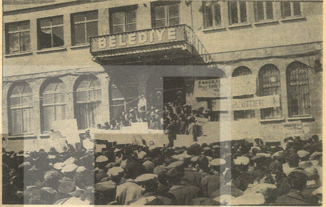
Diyarbakır mitingine binlerce kişi katılmıştı.

lanmaması ve ülkede antiemperyalist ve antifeodal mücadele sorunları olmuştur. Konuşmalar arasında Nazım Hikmet'in Memleketim ve Şemsi Belli'nin Anayasa şiiri okunmuştur.