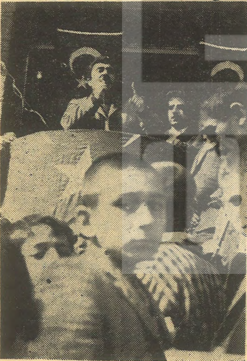
FKF Erzurum sekreterliğinden bir genç