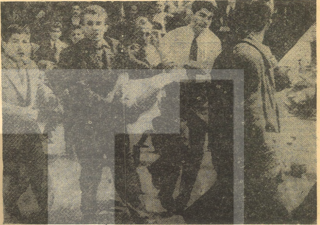
28 Nisan'da satılmış iktidarın uşakları gençleri kurşunlamıştı.