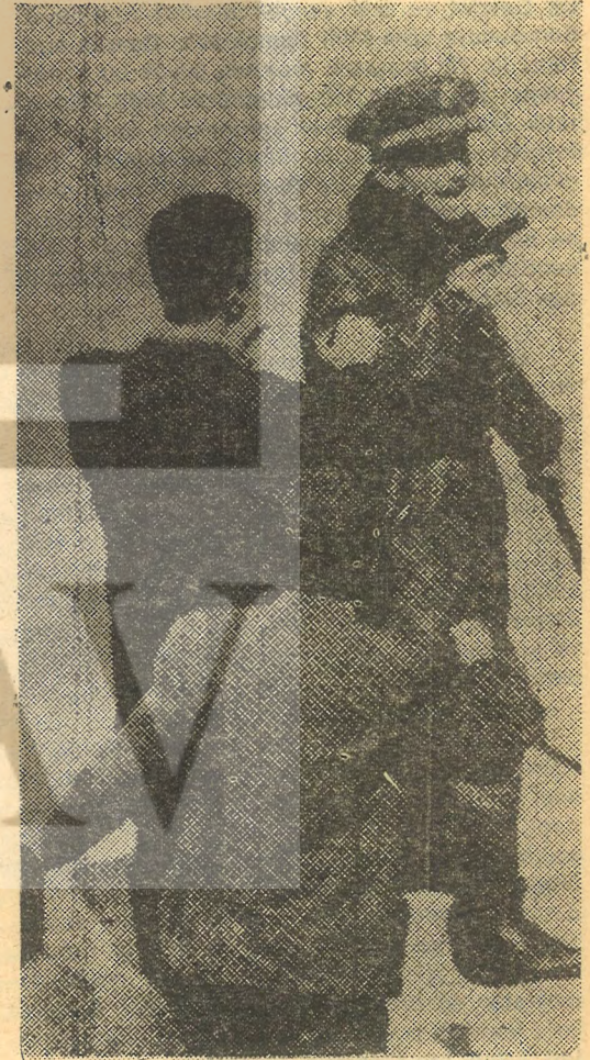
28 Nisan İstanbul — Çekilen silâh kime? —

litanlar tekrar görevleri başına dönmüşlerdir. Cuma akşamı ve Cumartesi günü de bildiri dağıtma ve afişleme devam etmiştir.