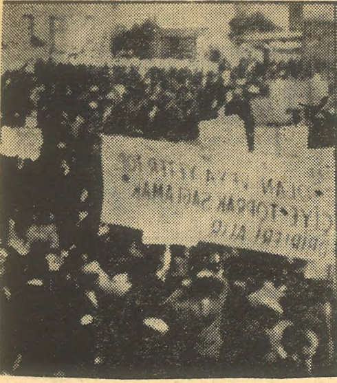
AĞALARIN YÜREĞİNE KORKU SALAN BÜYÜK SÖKE MİTINGİ

nunsuz harekete geçmesini önleyecektir. Bir durum muhakemesi yapmak üzere aramızda bir toplantı yapılmasını teklif etmekteyiz.»