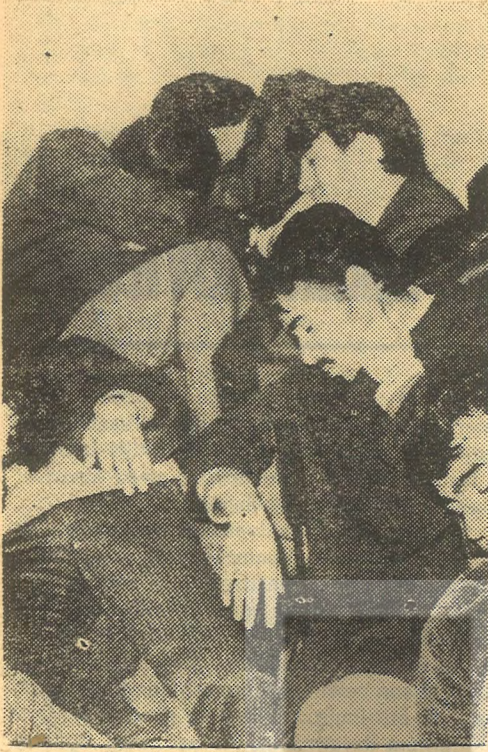
Kahvelerde sabahlayan gençler

Bu olaydan bir kaç saat sonra Çapa Yüksek Öğretmen Okulunda sağcılar tahriklere girişiyorlardı.