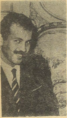
Abdelaziz Bu teflika

Çıkarları toprak mülkiyetinin korunması ve özel sermayenin gelişmesine bağlı olan sosyal tabakaların bugün etrafında kümelenen adamlar işte bunlardır.