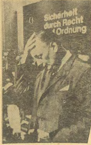
VON THADDEN Hitlerin halefi

Koalisyon hükümetinin ileri gelenleri tarafından resmen açıklandığına göre, Batı Alman politikasının iki ana hedefi vardır. Bunların birincisi - ki, ancak savaş yoluyla gerçekleştirilebilir - Nazi Almanyası'nın sınırları içinde bulunan Doğu Almanya, Polonya'nın büyük bir kısmı ve Sovyetler Birliğine ait bazı bölgelerin geri alınmasıdır. (Bu toprak talepleri; Avusturya, Çekoslovakya'nın bazı bölgeleri ve hattâ Alsace-Lorraine kesimine kadar uzanmaktadır.) İkinci ana hedef ise, Doğu Almanya'nın geri alınmasının bir savaş sorunu olmadığına, fakat Almanya'nın kendi iç sorunu olduğuna gerekçe hazırlamak için, Batı Almanya'dan başka bir Alman devletinin bulunmadığını, bütün Alman halkını temsil etme ve yönetme yetkisinin yalnızca Batı Almanya'ya ait olduğunu, ve Batı Almanya ile diplomatik ilişki kurmak isteyen bütün devletlerin Doğu Almanya'yı tanınamalarını kabul ettirmektir. Nitekim Başbakan Kiesinger 13 Şubat 1966 da yaptığı konuşmada şöyle demektedir: