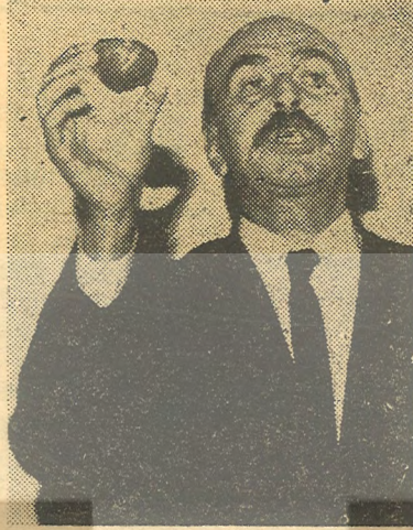
A Y B A R

Bir toplumun millîci güçlerinin emperyalist boyunduruğu parçalama yönünde giriştiği hareketleri anarşi olarak nitelendirenler; ancak bu hareketlerden zarar gören emperyalistler, işbirlikçileri ve onların bilerek ya da bilmeyerek dümen suyundan ayrılamayan «bayağı politikacılar»dır. Şayet emperyalizmin egemen olduğu bir ülkede kitlevi nitelikte anti-emperyalist ha-