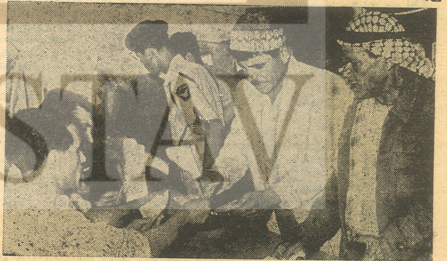
Arap mültecileri dışarı...

Her ne olur sa olsun B. D. emperyalizmi, oralarda popüler olmaktan çıktığı için Orta Doğu petrolü üzerindeki pençesini gevsetecek değildir. Bu bölgede ilerisi için çetin mücadeleler yattmaktadır. Batı Avrupa ülkeleri ve İsrail halkları gibi Amerikan halkının da bu mücadelede petrol şirketleri ile nesnel ortak bir çıkarları yoktur. Bununla birlikte onlar hükümetlerinin saldırgan etkinliklerini engellemeye muktedir olmadıkları sürece, bu gibi etkinliklerin sonuçlarından Amerikalılar eninde sonunda acı çekeceklerdir.