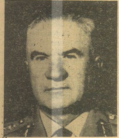
T U R A L

Gelecek yıl bir milyon çocuğa çiçek aşısı yapılacağını söylemekle işledikleri günahlardan kurtulamaz bu beyler.