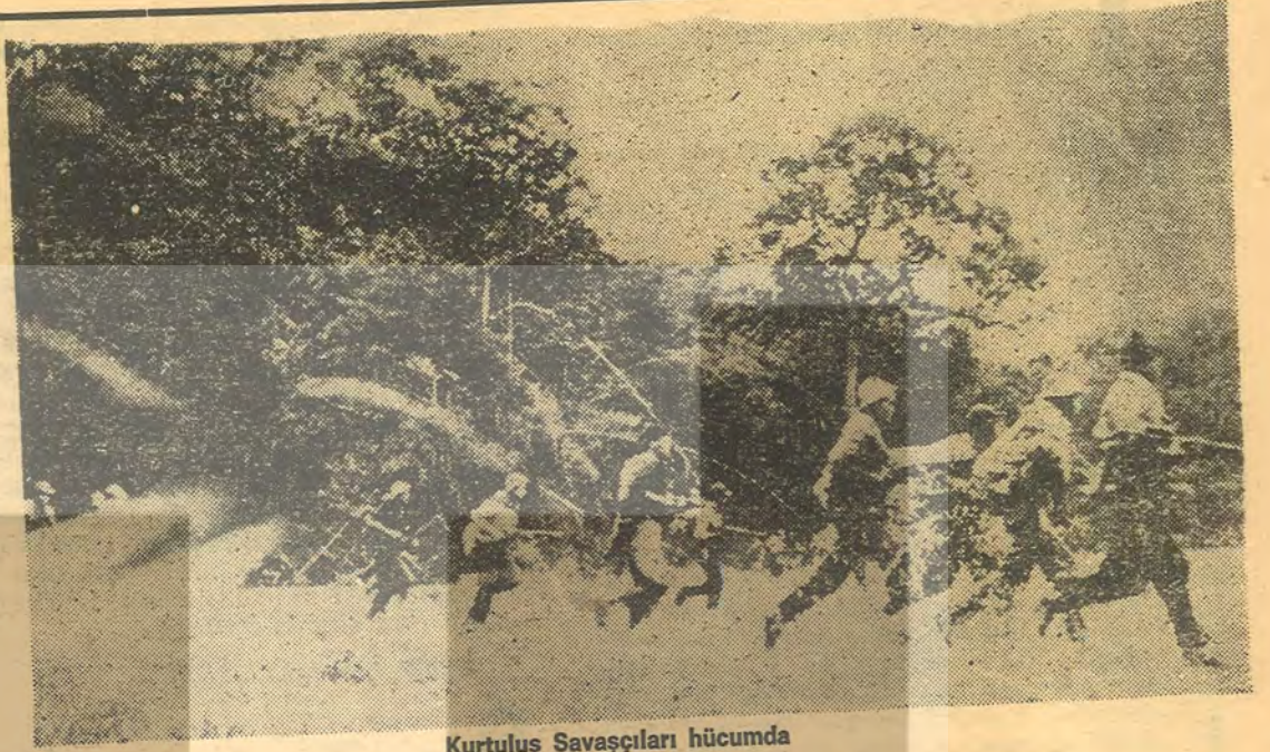
Kurtuluş Savaşçıları hücumda

Şu ana kadar gelen haberlere göre... Kurtuluş cephesi taarruzu, geçen yılki Têt taarruzu boyutlarına erişmiş değildir. Fakat 72 hedefe birden aynı anda ve başarıyla hücum ederek, Ulusal Kurtuluş Cephesi, gücünü ve ülkenin gerçek sahibi olduğunu, dünyaya bir kere daha ispatlamıştır.