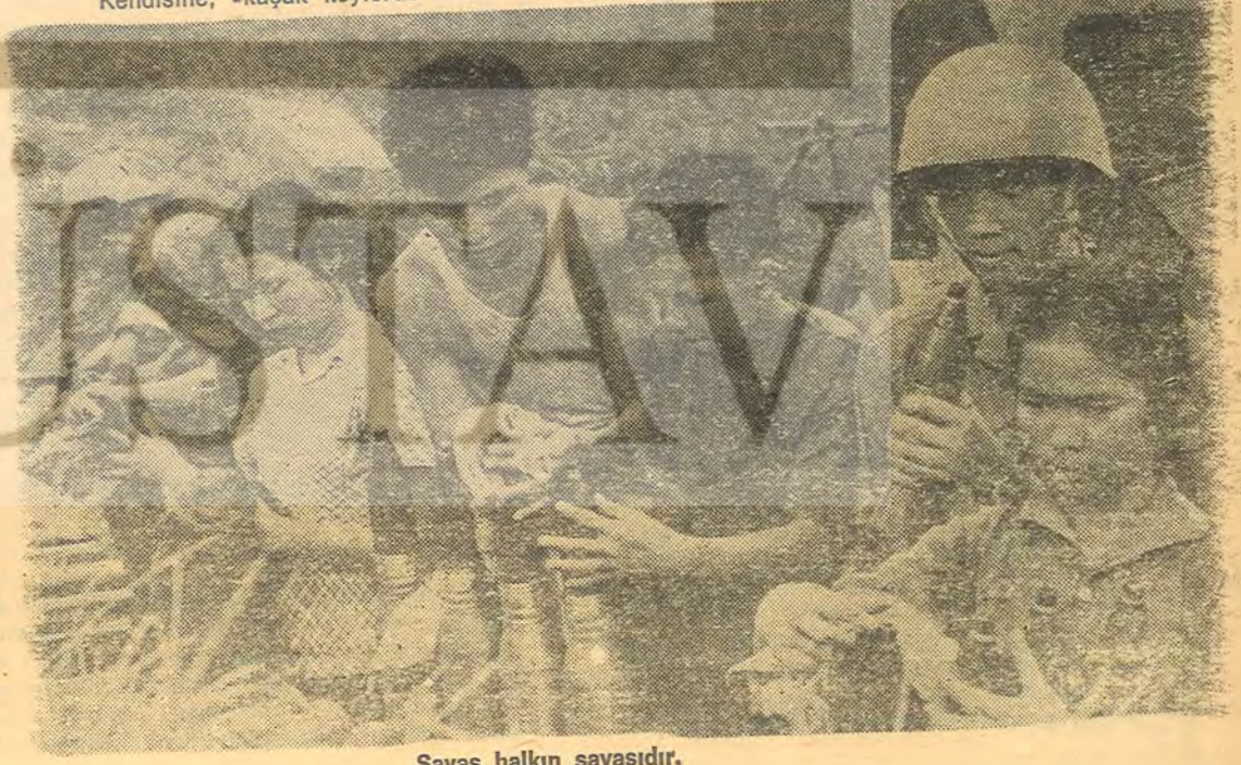
Savaş halkın savaşıdır.