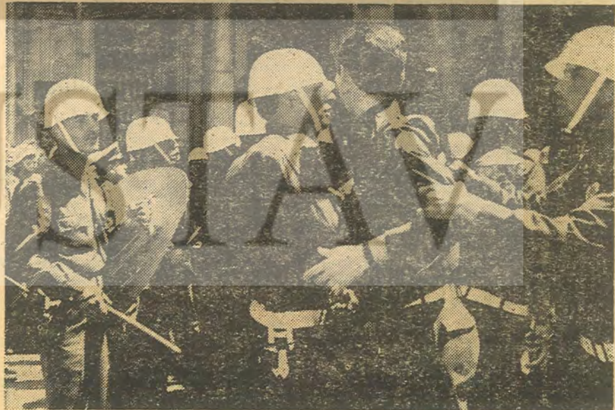
— Bu polis kimin polisi ki? —

Yaşasın ATA'nın kurduğu Türkiye Cum-huriyeti, kahrolsun Vahdetin mirasçıları.