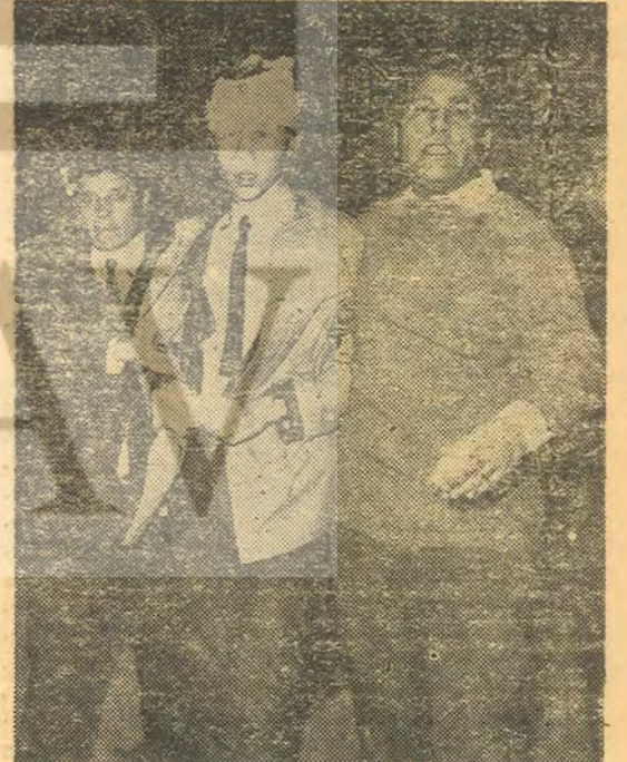
ve kurbanları. Henüz 15 yaşında bir lise talebesi. Sinemadan çıkmış eve dönerken kan içinde.