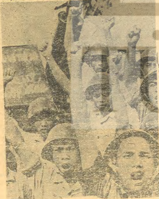
Tam bağımsız Vietnam için