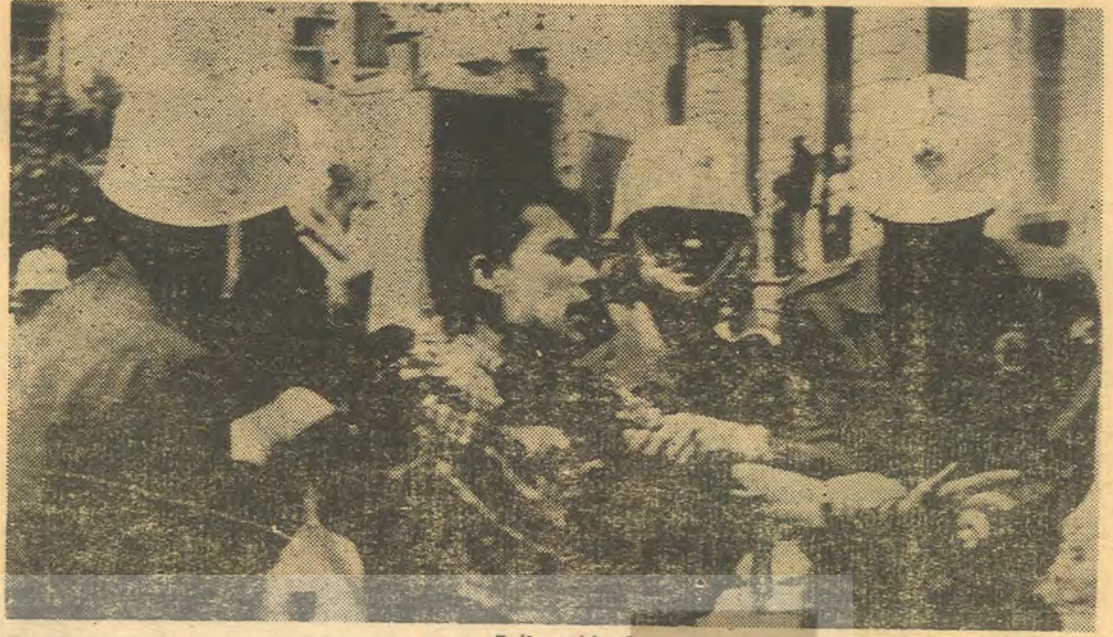
Polis saldırıda — Bir süre sonra Beşiktaş Karakoluna gidilecek —

Bulduğumuz yerden çıktığımızda salonlarda biraz olsun polis sakinleşmişti. Eskisi gibi sopa filân yoktu. Vardık ifademdi aldılar. Sırtımdaki parkeye bakıp «bu da öteki keratolar gibi giymiş» dediler. Şöyle kendikendime bir düşündüm; 1920 de Yunan'ı bize karşı İzmir'e çıkar-tan Amerikalıları, istemiyen Türkler, yine Türkler tarafından sorguya çekiliyor ve işkence gör-üyor. Dedelerimiz bu vatan için kanlarını verdiler. O zaman dedelerimizin kanını döken adamlar şimdi gene memleketi sömürüyor ve karde-şi de kardeşe kırdırıyor. Bu ne acı bir şeydir.