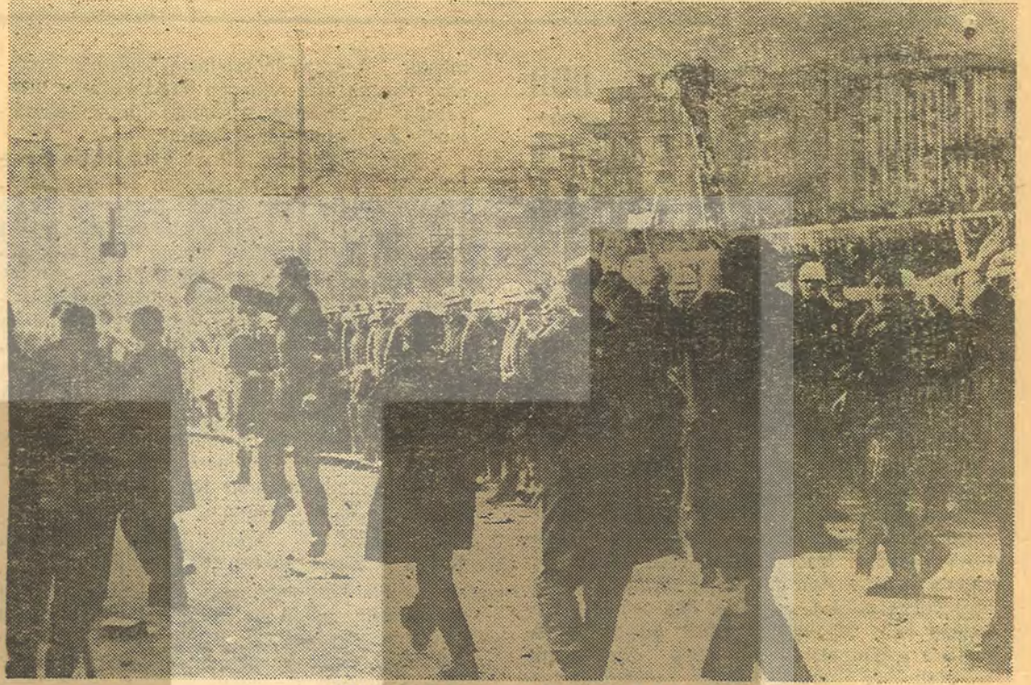
Saldırganlar 6. Filoya yaranmanın sevinci içinde