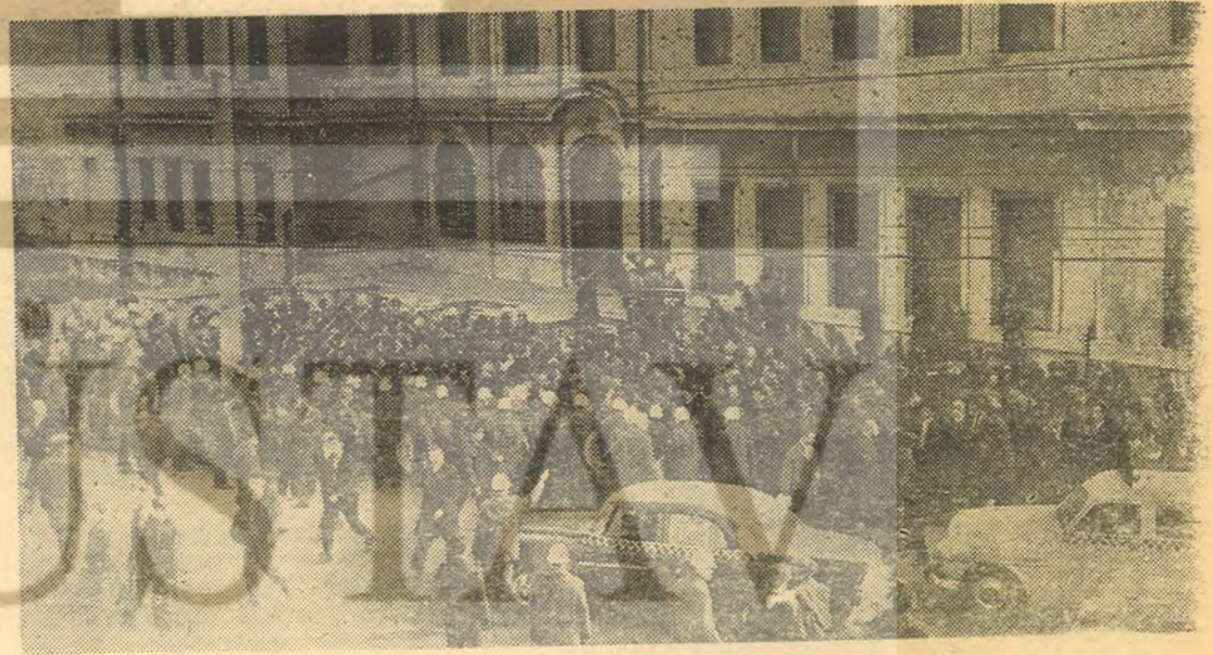
Kanlı pazarın sabahı Dolmabahçe Camiinde namaz kılmak için toplanmağa başlayanlar.

Olaylar sonunda miting tertip komitesi mitingten vazgeçmek zorunda bırakılmışlardır. Saldırganlar daha sonra «Yaşasın Amerika, yaşasın 6. Filo» diye tempo tutmuşlardır» denilmektedir.